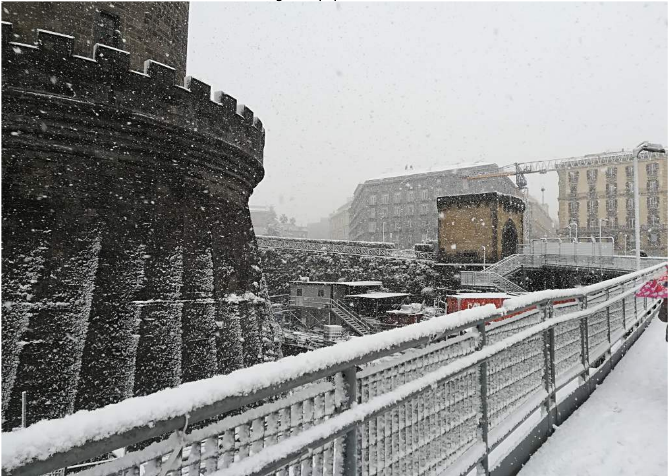
Neve a Napoli - Maschio Angioino - 27 febbraio 2018.

Il forte vento di Bora nella parte finale del mese ha causato la formazione di grosse quantità di neve, anche a basse quote, come quella caduta nella mattinata del giorno 27 Febbraio che ha messo in scacco la città, arrecando notevoli disagi alla popolazione.