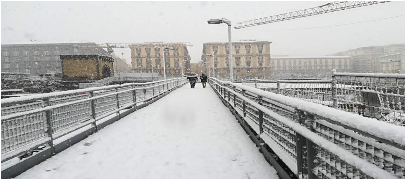
Passerella pedonale adiacente il Maschio Angioino - 27 febbraio 2018.