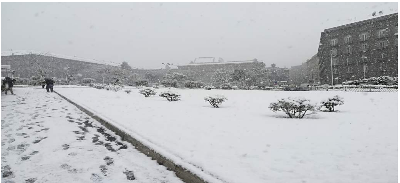
Aiuole adiacenti il Maschio Angioino -27 febbraio 2018 .