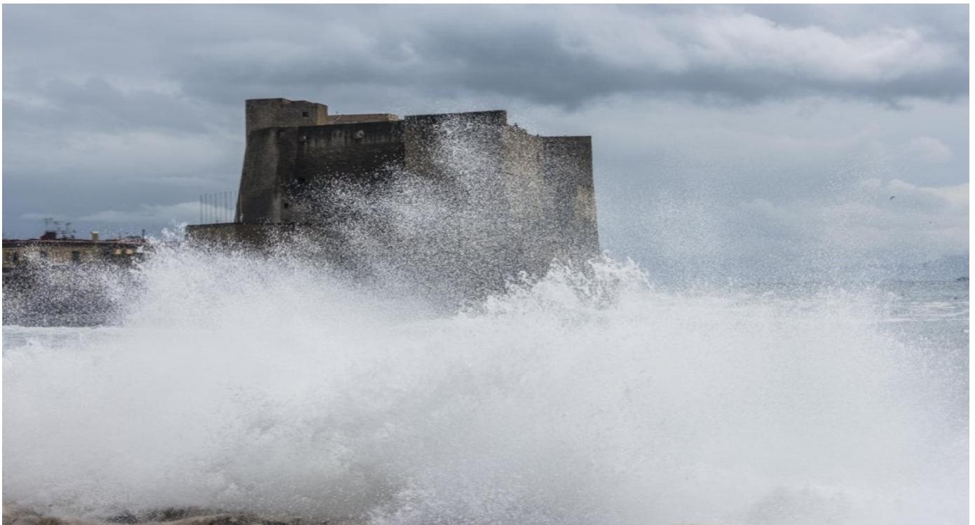
2 Marzo 2018 - forte mareggiata in Via Caracciolo.

Il giorno più freddo è stato il 1 Marzo con una temperatura minima di 2,9°C .