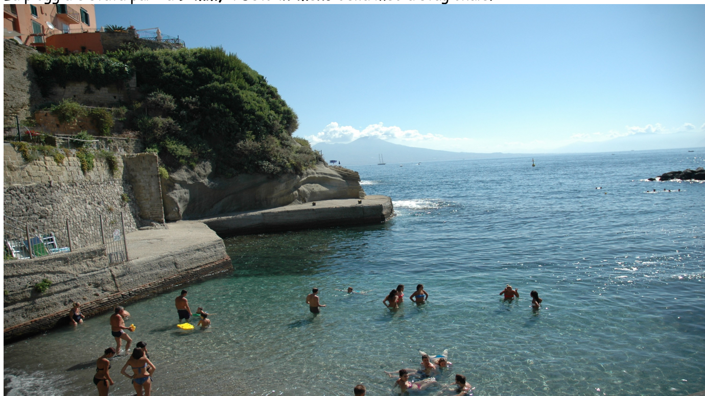
Luglio 2018 - Spiaggia della Gajola

La pioggia è stata pari a 9 mm , il 50% in meno della media stagionale.