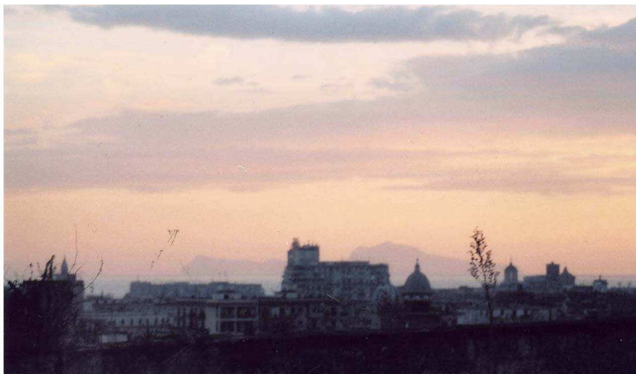
Vista dalla terrazza su Piazza Carlo III