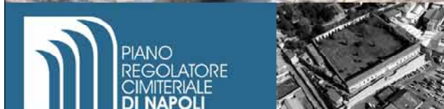
6.c.8.2. Cimitero di CHIAIANO IMMAGINI FOTOGRAFICHE