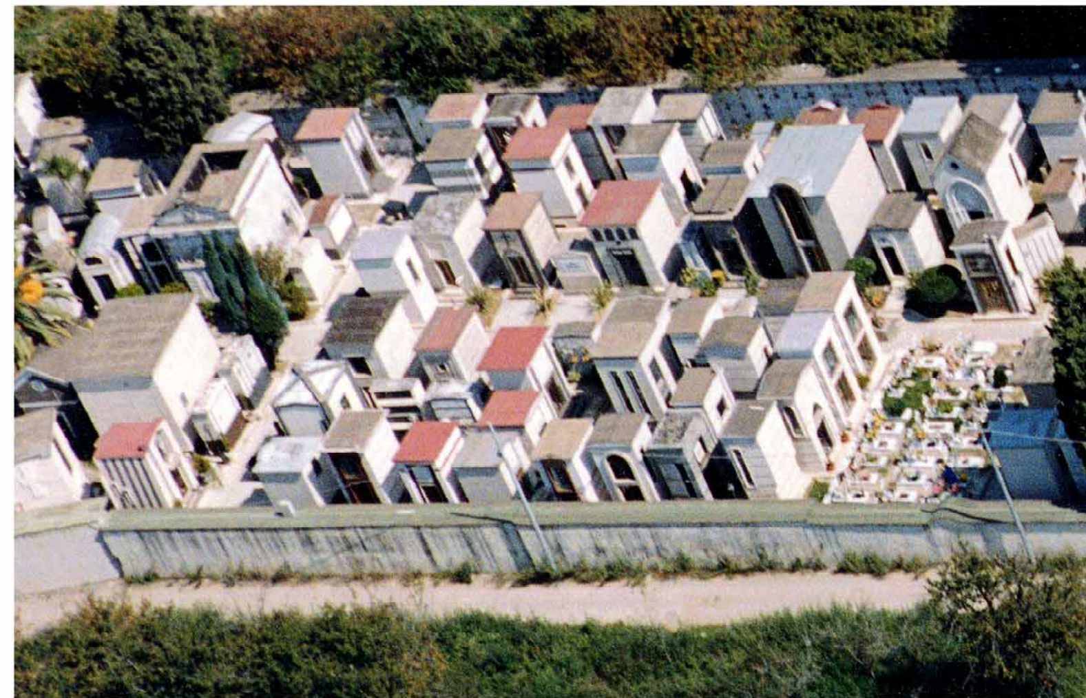
6.c.7.2. Cimitero di CHIAIANO IMMAGINI FOTOGRAFICHE AEREE