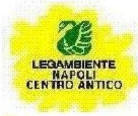
LEGIAMBIENTE NAPOLI CENTRO ANTICO