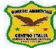
GUARDIE AMBIENTALI CENTRO ITALIA SERVIZIO REGIONALE DIFESA P. 081 - 5771.00