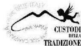
CUSTODI DELLA TRADIZIONE