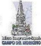
Libro Campese Campese CAMPO DEL MIRACOLO