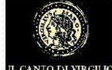
IL CANTO DI VIRGILIO