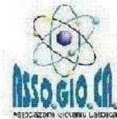
ASSOGIOCHI ASSOCIAZIONE GIOVANI LUDICI