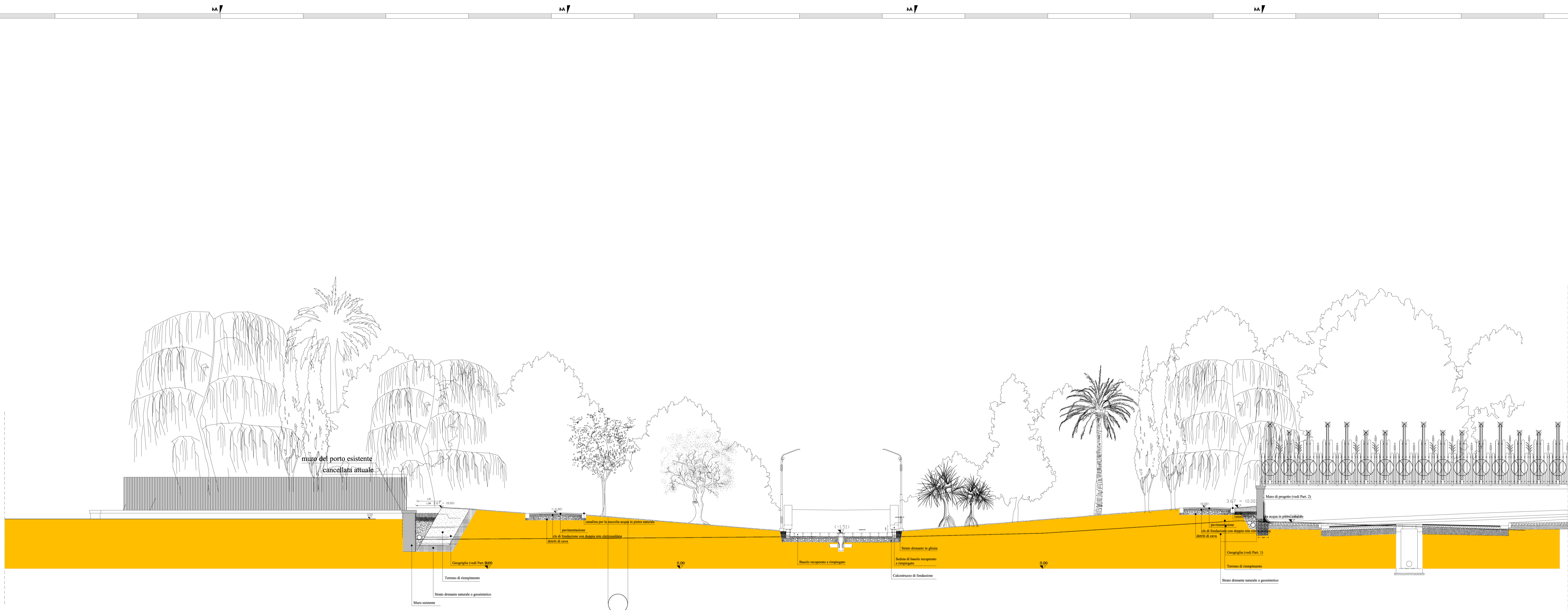
Sezione esecutiva trasversale n° 1 di progetto - Scala 1: 100