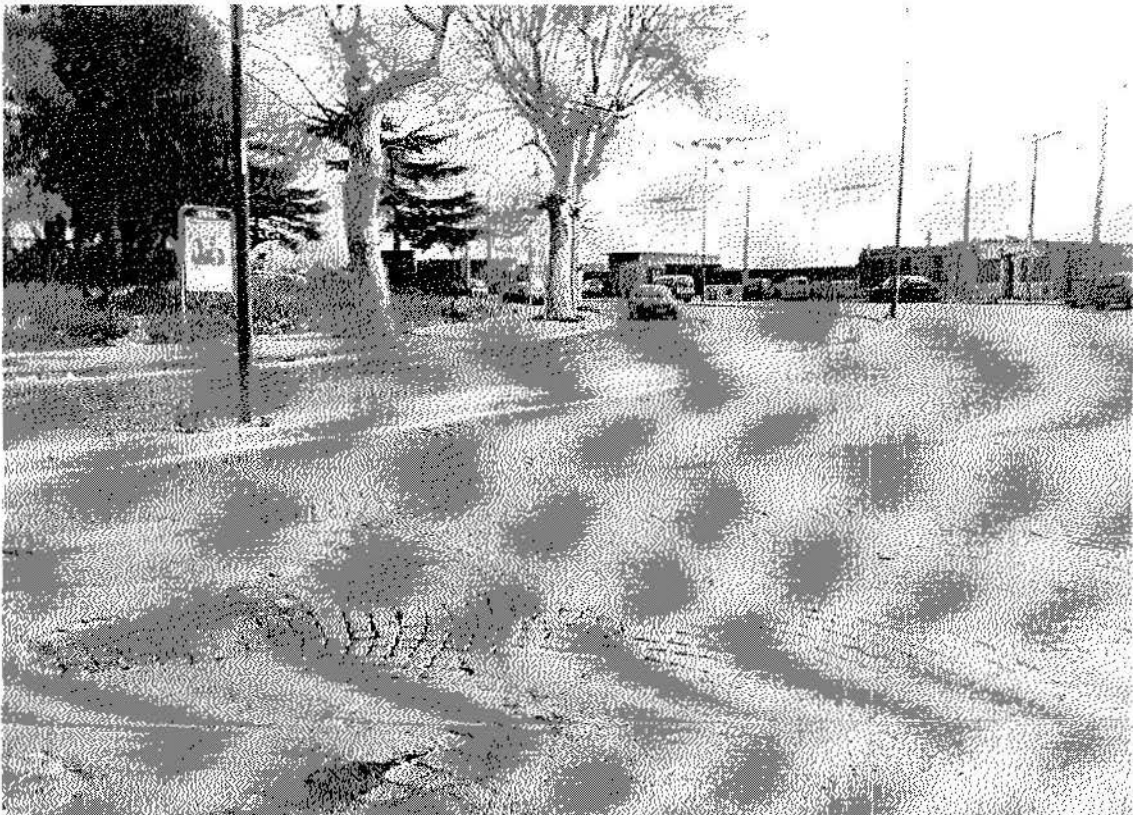
Via Nuova del Campo, il tratto in cubetti