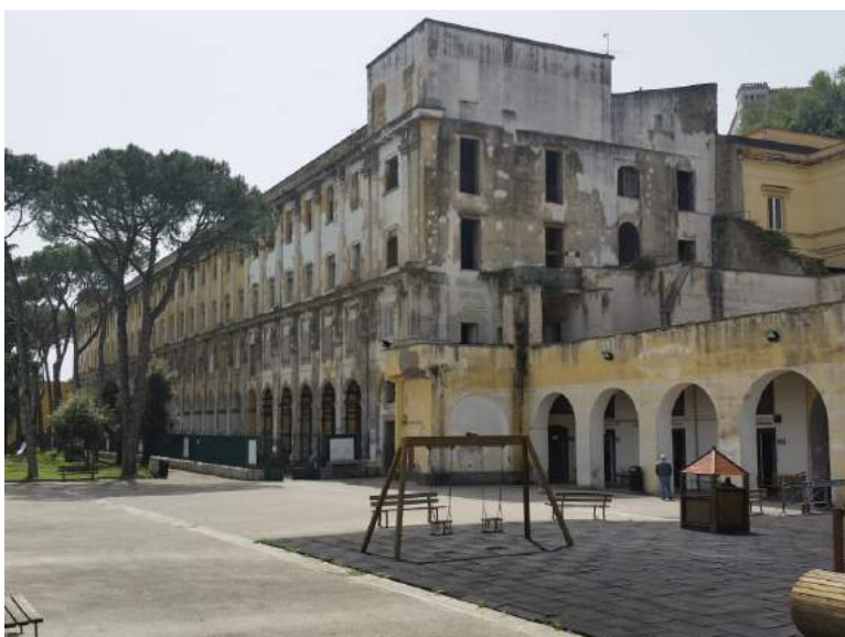
Edificio C, vista dal giardino superiore e dettaglio del porticato