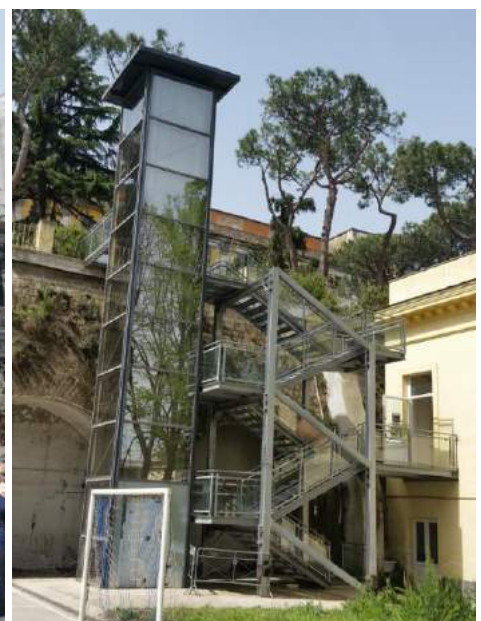
Collegamenti verticali tra piazza Montesanto e vico Paradiso, e tra il giardino inferiore e quello superiore