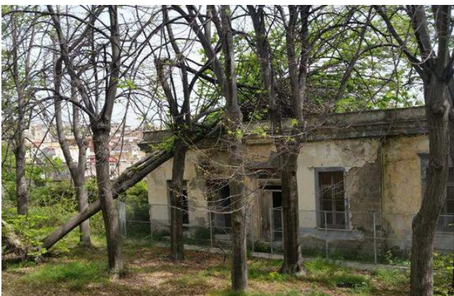
edificio M, vista dal giardino inferiore e da vico Paradiso

L'edificio M, è interdetto al pubblico. Le condizioni di degrado diffuso, richiederebbero un intervento di recupero complessivo dell'immobile, non stimabile unicamente attraverso l'indagine visuale. Si sottolinea che su uno dei due corpi dell'edificio M che emergono oltre la quota di calpestio del giardino inferiore, si è abbattuto un albero provocando danni al piano di copertura dell'edificio.