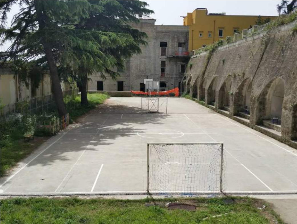
Aree G, F ed E

Aree G, F ed E: campetti sportivi aperti agli utenti dell'educativa territoriale accompagnati dagli operatori sociali.