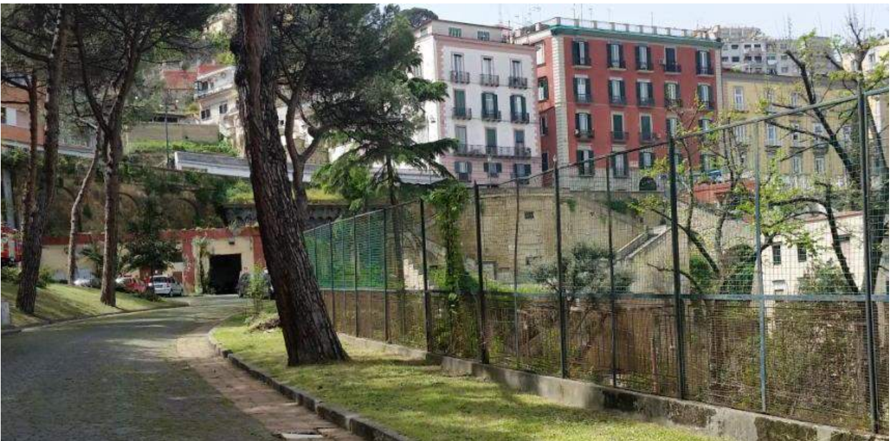
Edificio B (in fondo al viale)

Edificio B: edificio realizzato in tempi recenti, non ristrutturati e adibito a locale tecnico (cabina elettrica).