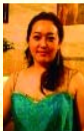
Shin Sung Hee Mezzosoprano