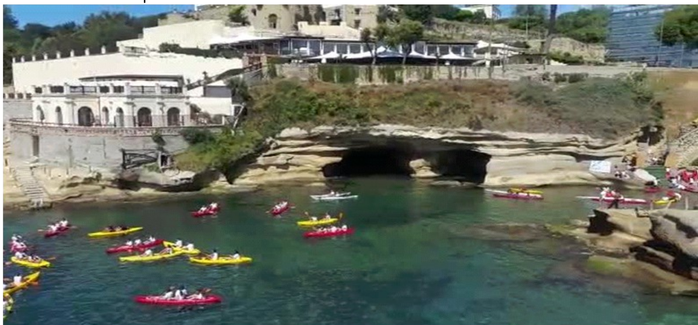
Aprile 2018 - Area marina protetta della Gajola -

Tutto ciò è stato determinato dalla presenza quasi costante dell' anticiclone africano sul sud Italia che ha determinato valori elevati di pressione, di umidità notturna ( quasi il 90% ) e presenze di venti meridionali carichi di polveri desertiche.