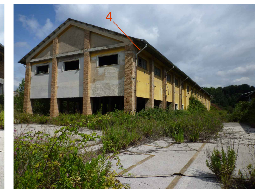
Manufatto 4 - fronte trasversale Sud