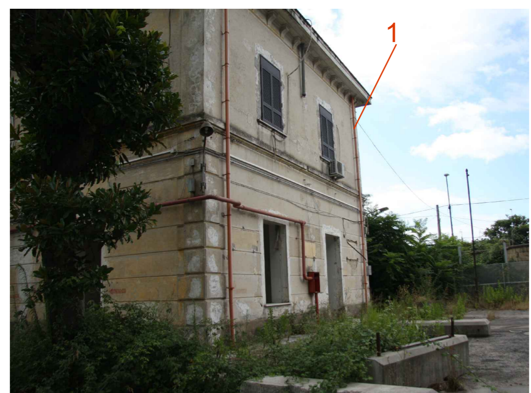
Manufatto 1 - fronte trasversale