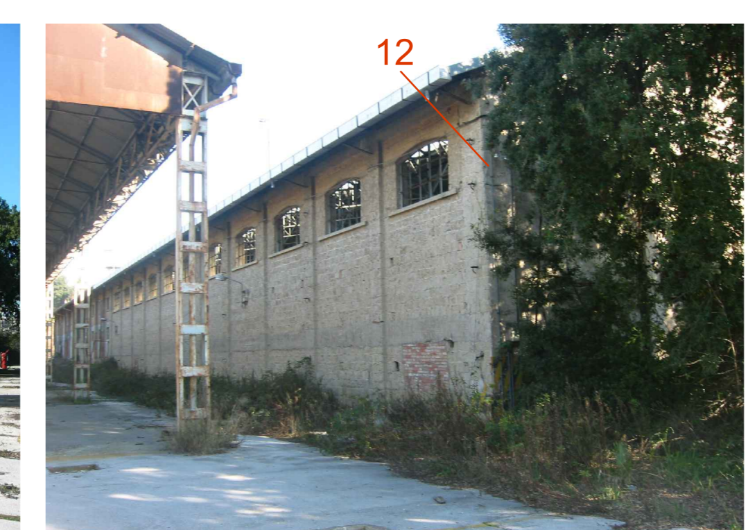
Manufatto 12 - fronte trasversale Sud