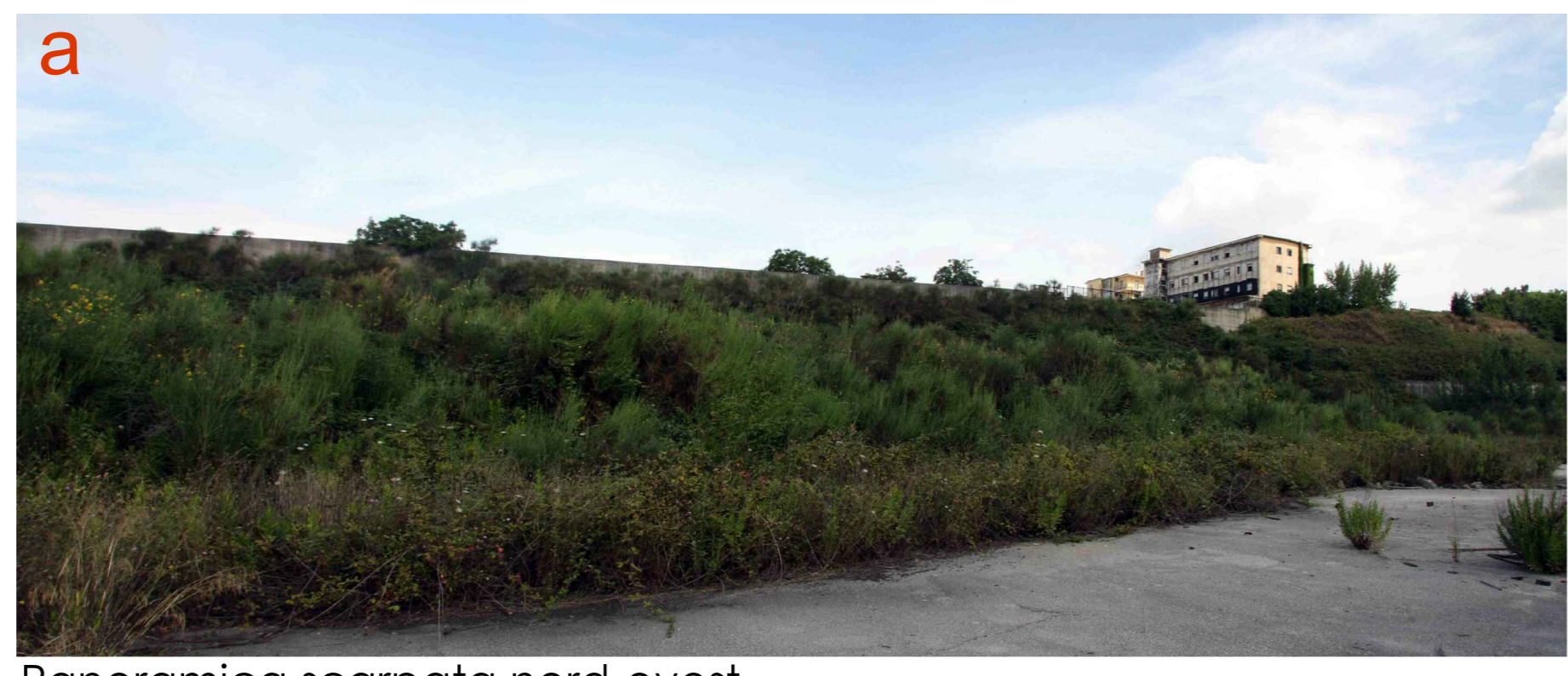
Panoramica scarpata nord-ovest