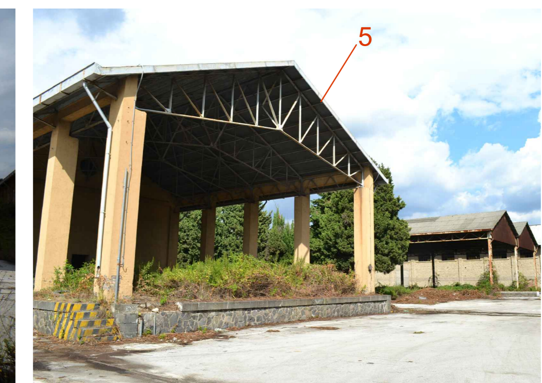
Manufatto 5 - fronte trasversale Sud