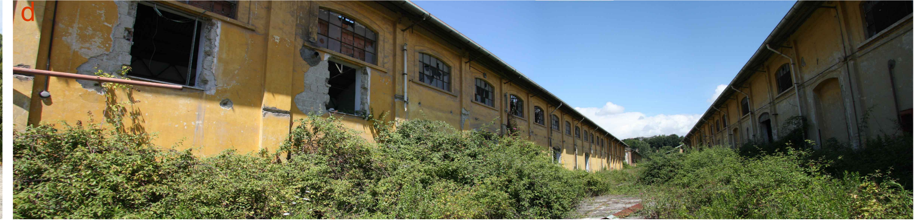
Panoramica viale principale