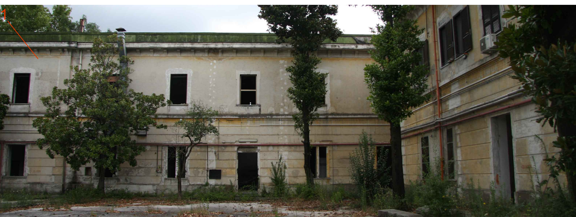
Manufatto 1 - fronte longitudinale