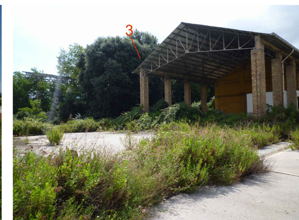
Manufatto 3 - fronte trasversale Nord