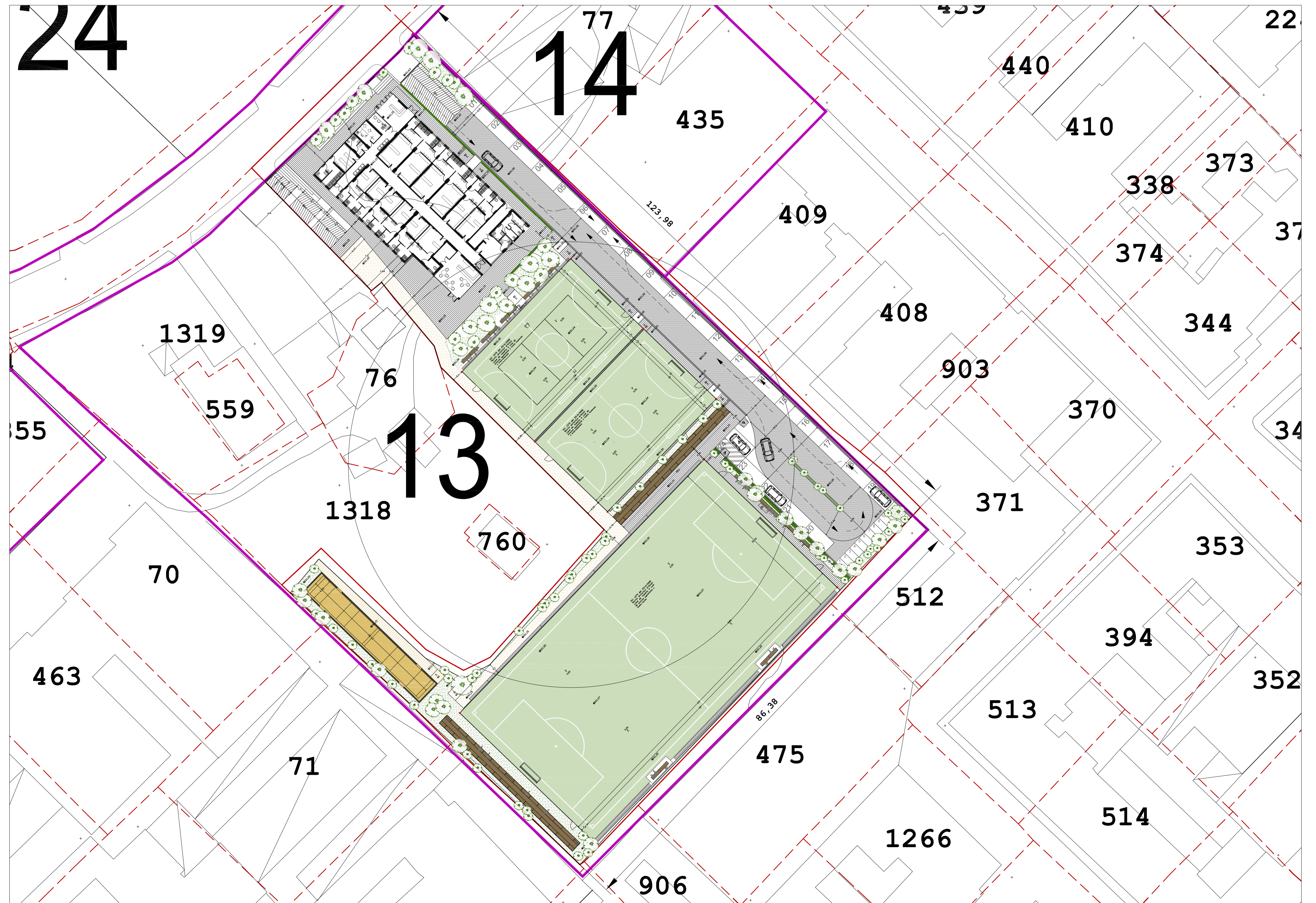
2.B - Progetto - Sovrapposizione cartografia 2004-Catasto_Terreni-Specificazioni

COMUNE DI NAPOLI Dipartimento di pianificazione urbana