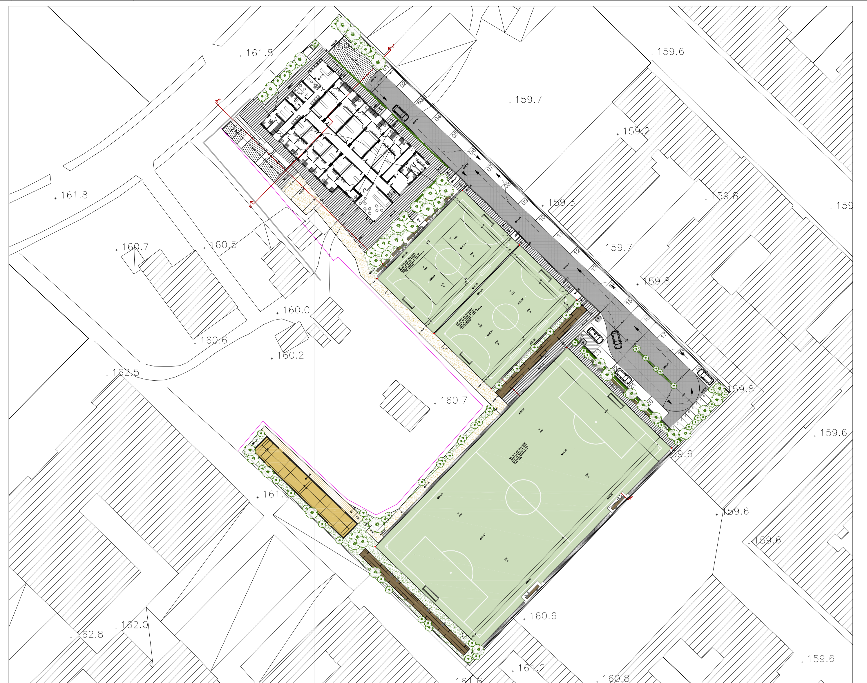
1.B - Progetto - Sovrapposizione Aereofogrammetrico 2004 e rilievo topografico