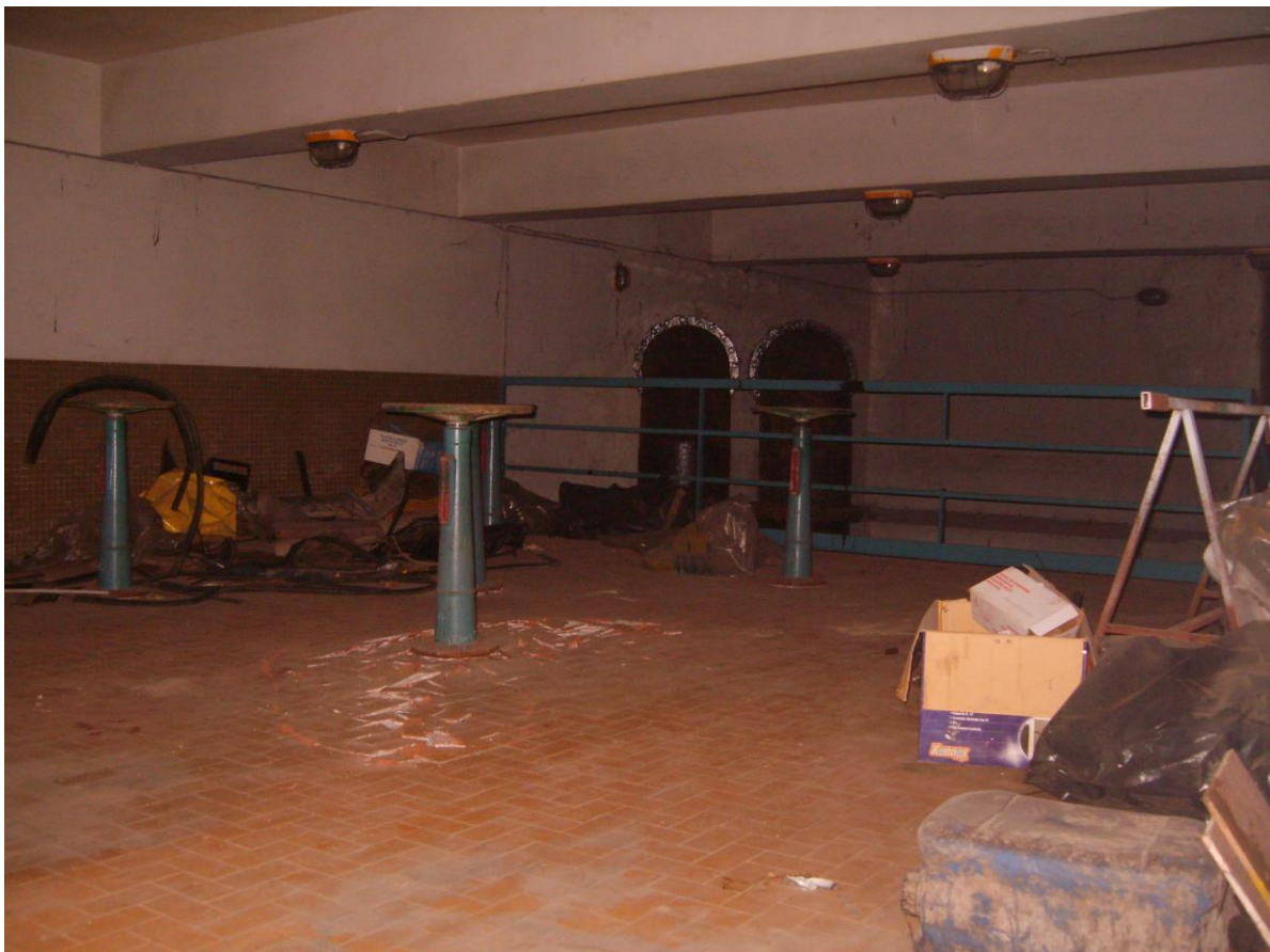
Partenza prementi DN 600 – Impianto Rondinella

dotato di n.4 pompe che sollevano le portate provenienti dalla zona Occidentale rispetto all'asse idraulico del Volla (via Ferrante Imparato, via Barbato, ecc.) e convogliate in esso da una tubazione circolare DN 1.800 mm. che si innesta in un canale rettangolare di arrivo (160 x 160) dotato di grigliatura. Nell'impianto, oltre alle acque nere e frazione di pioggia, vi è un consistente ingresso di acque di falda, fenomeno emerso negli ultimi anni con emersione della falda anche a livello di campagna. Talché si è potuto constatare, che in periodi asciutti, l'impianto solleva una portata nera diluita dalla mescolanza con le acque di falda. Il recapito attuale dell'impianto Rondinella è rappresentato dallo scatolare 130x160 di cui si è fatto precedentemente cenno (scatolare Rondinella) che, partendo dall'incrocio di via Alveo Artificiale con via Volpicelli, in corrispondenza dell'ingresso alla Chemical Express, convoglia le acque miste fino all'impianto di San Giovanni a Teduccio, by-passando l'impianto di Pollena, e snodandosi attraverso via B. Quaranta. La mandata attuale è costituita da n.2 prementi in acciaio DN600.