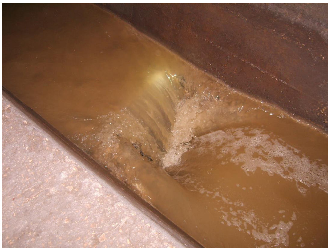
Foro sul fondo canaletta nera del Volla

In sostanza, le condizioni attuali del collettore Volla determinano la commistione delle acque con conseguente scarico nel Mare di acque fortemente inquinate.