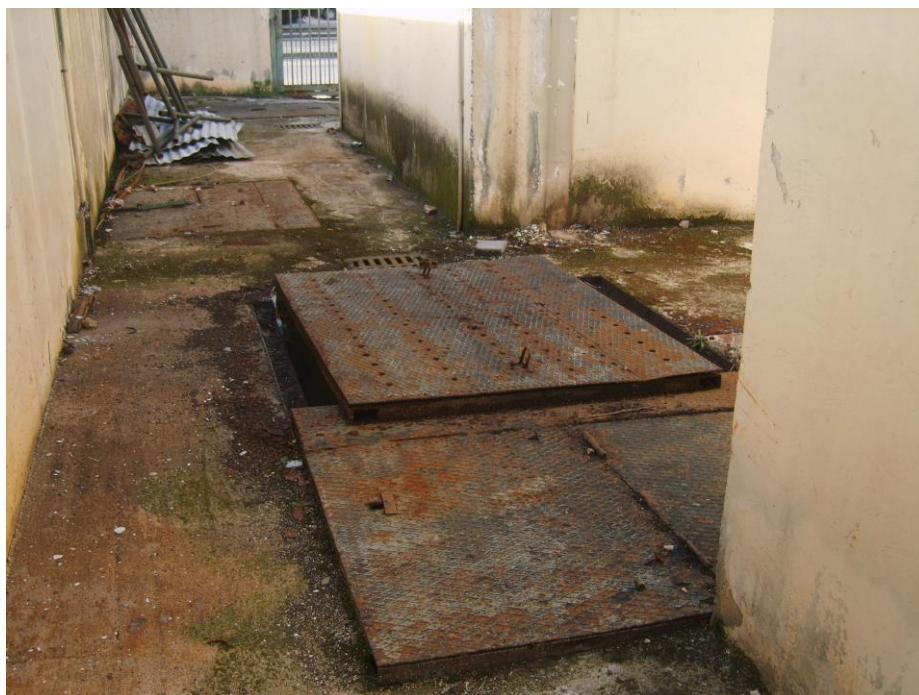
Botole accesso grigliatura Pollena

La mandata dell'impianto consiste in due prementi DN 500 in acciaio accoppiate da posarsi, prevalentemente in asse al collettore Volla, in corrispondenza della aiuola spartitraffico di via 2 Giugno. La lunghezza del tratto a doppia premente è di circa 1.060,00 m.