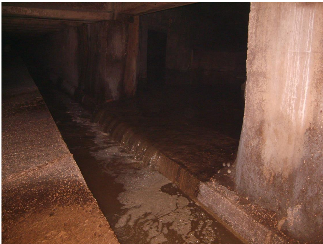
Immissione collettore Ponticelli nella canaletta Volla

Talché ne consegue una portata massima immessa nella nuova stazione di Ottaviano pari a :