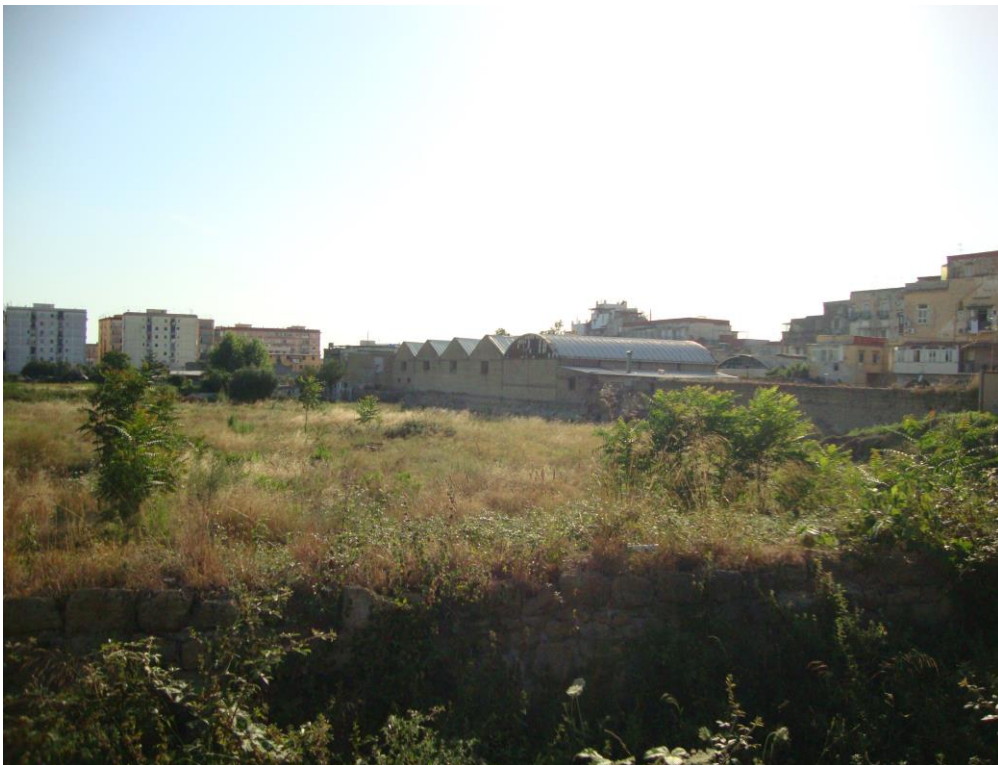
FOTO 8 Vista del lotto da via Aviglione