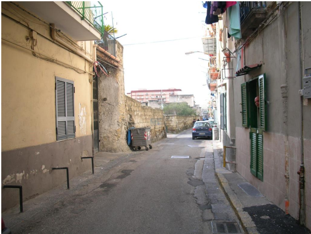
FOTO 1 Via Bernardo Quaranta (verso Est) - in lontananza il varco di ingresso del viale esistente