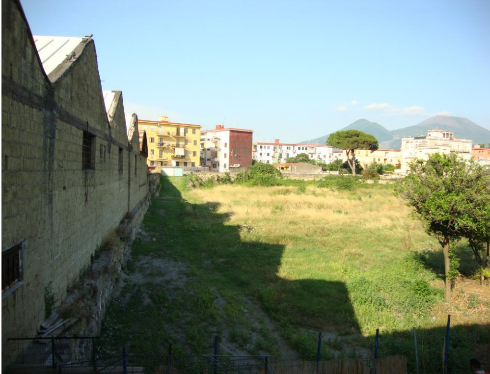
FOTO 9 Porzione del lotto con vista da Ovest