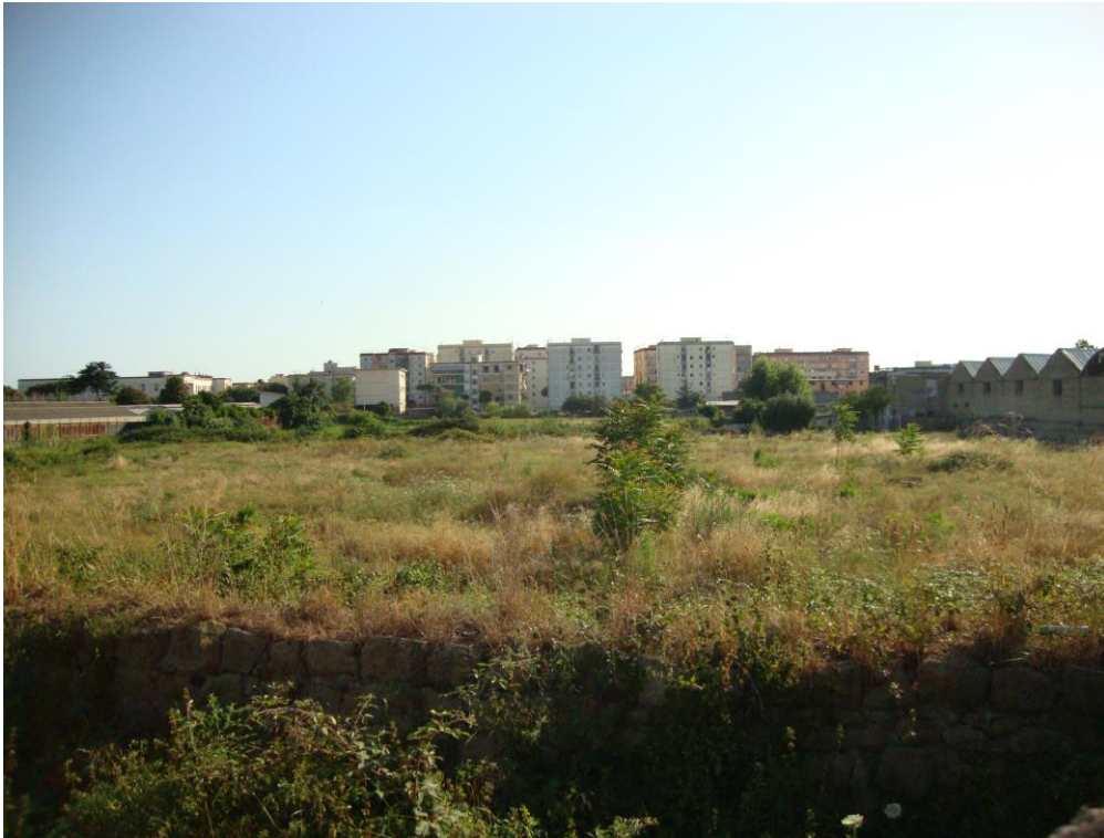
FOTO 7 Vista del lotto da via Aviglione