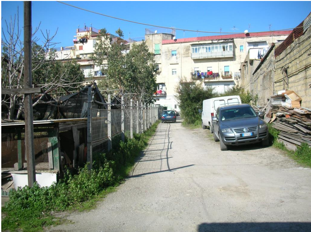
FOTO 12 Scorcio strada esistente di accesso al lotto da via B.Quaranta.