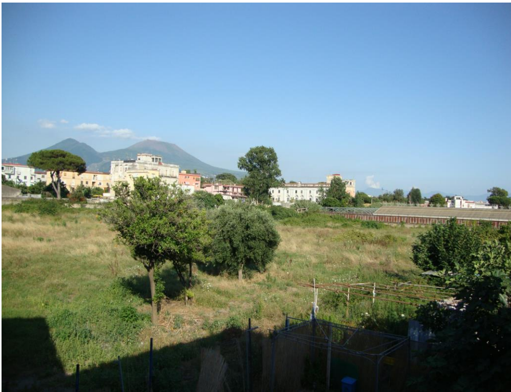
FOTO 10 Porzione del lotto con vista da Ovest.