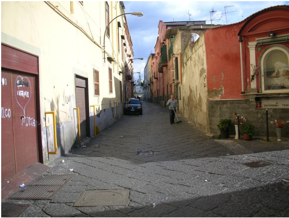
FOTO 5 Via B. Quaranta edicola votiva incrocio con via Aviglione.