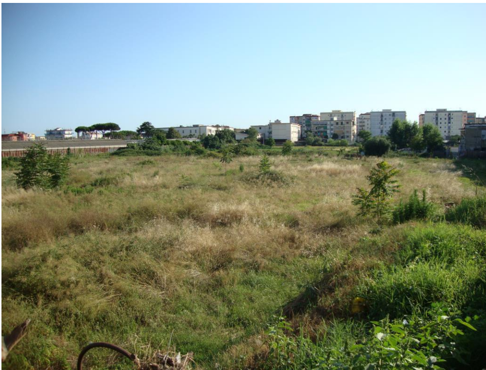
FOTO 6 Vista del lotto da via Aviglione