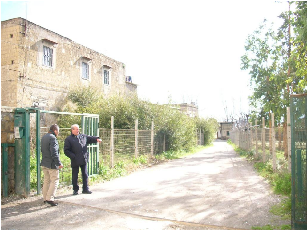
FOTO 11 Strada esistente di accesso al lotto – ingresso da via B.Quaranta.