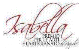
Premio PER LE ARTI E L'ARTIGIANATO