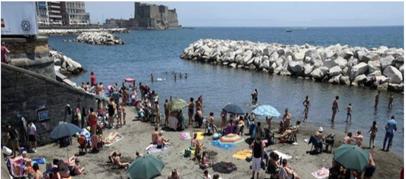
Agosto 2018 -Spiaggetta Colonna Spezzata - Piazza Vittoria.

Le piogge piuttosto scarse in Agosto (media 20 mm) invece quest'anno sono state abbondanti con circa 60 mm e distribuite in 11 giorni, con ben 8 temporali ed alcune bombe d'acqua (21 Agosto zona Fuorigrotta -Soccavo) che hanno creato molti disagi in città.