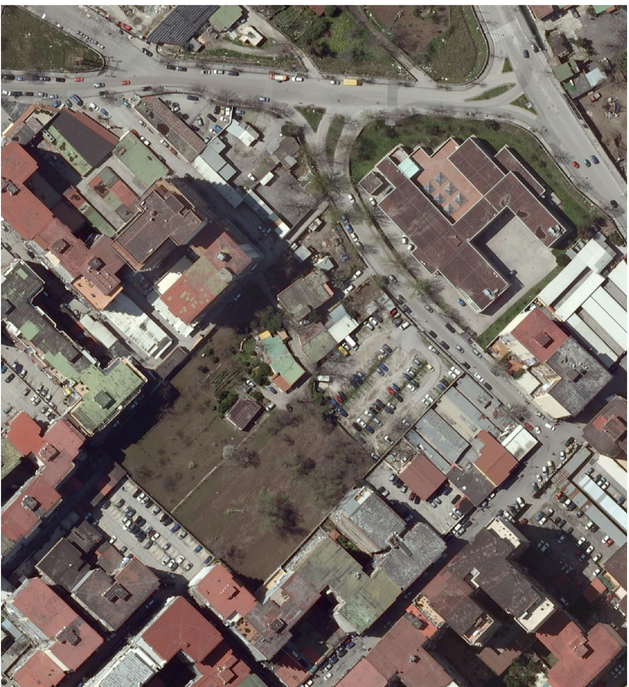
6 - vista zenitale