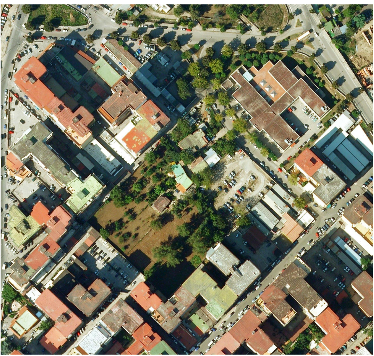
5 - vista zenitale