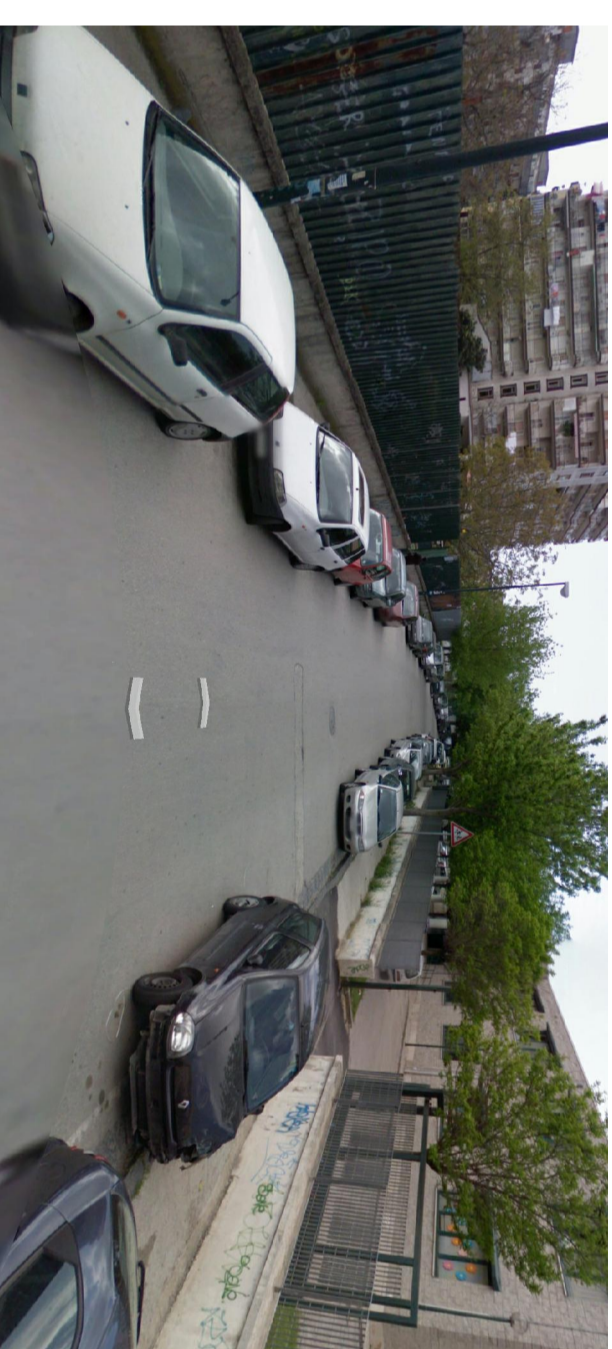
7 - vista strada direzione EST