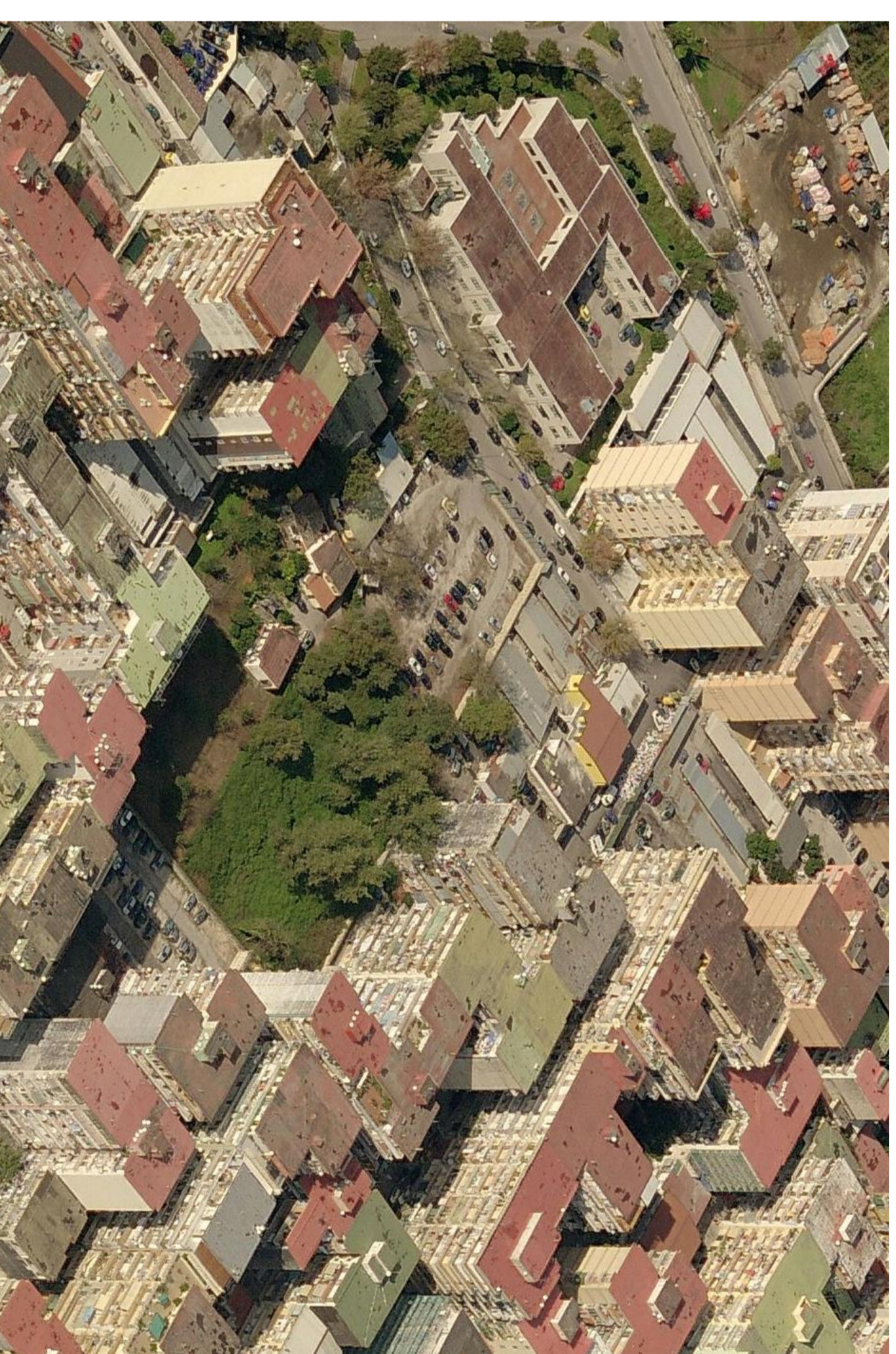
2 - vista SUD