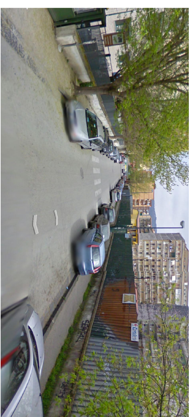
8 - vista strada direzione OVEST