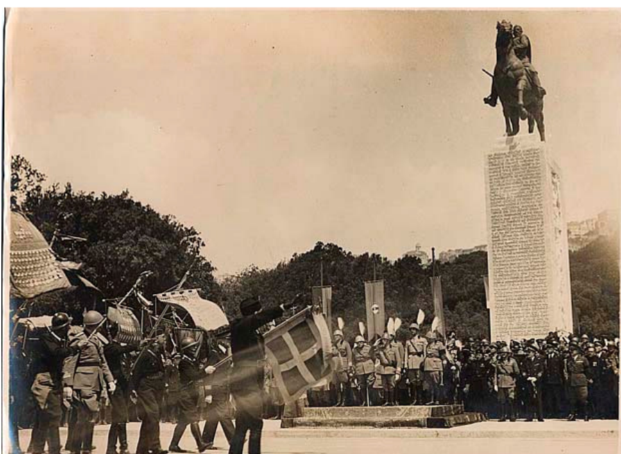
Inaugurazione della statua equestre di Armando Diaz.

Individuato il sito dove erigere il monumento nel novembre del 1933 fu pubblicato il bando di concorso. L'opera fu inaugurata il 24 maggio 1936. Il monumento è costituito da una statua equestre in bronzo su un basamento in pietra. La scarsità di interventi di manutenzione e l'inevitabile esposizione agli agenti atmosferici, nonché la vicinanza al mare, hanno causato fenomeni di corrosione ed incrostazioni. La statua si erge su un alto basamento di marmo. La statua del Diaz misura circa 5 m di altezza. Il monumento nasce dalla necessità di far vedere la statua equestre quale punto di riferimento anche dal mare. E' presente uno stemma littorio di casa Savoia che accompagna l'epigrafe: "Al maresciallo Armando Diaz Duca della Vittoria la Patria Riconoscente 1939. XIII.E.F." Ai lati vi sono bassorilievi che sintetizzano momenti di guerra. E' inoltre riportato integralmente il testo del bollettino della Vittoria. Il progetto architettonico è del livornese Gino Cancellotti, mentre l'esecuzione della statua bronzea è del viterbese Francesco Nagni.