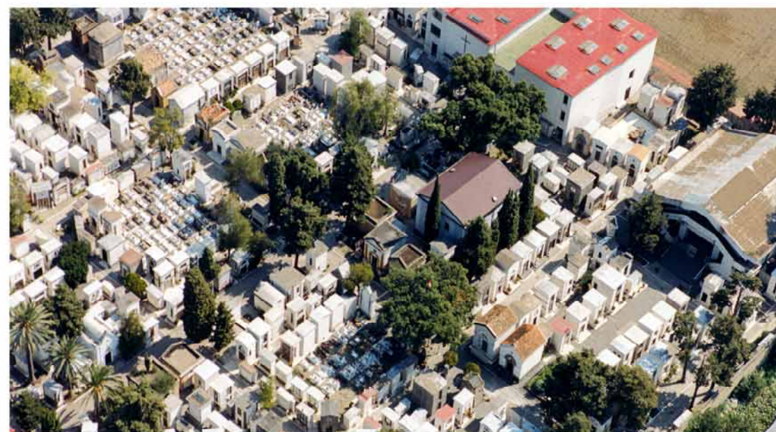
6.g.7.2. Cimitero di BARRA IMMAGINI FOTOGRAFICHE AEREE