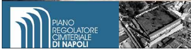
6.g.8.2. Cimitero di BARRA IMMAGINI FOTOGRAFICHE