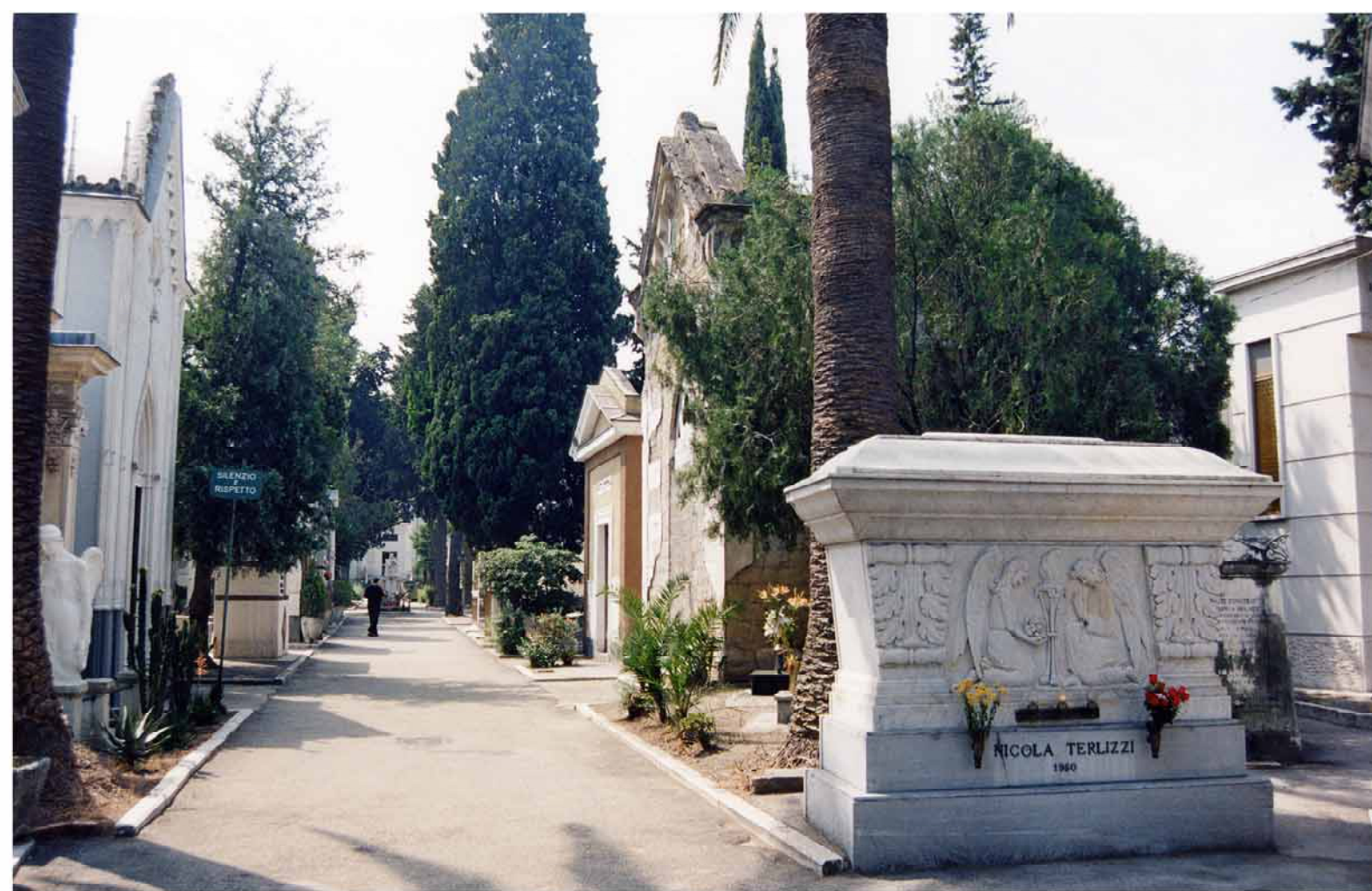
6.g.8.1. Cimitero di BARRA IMMAGINI FOTOGRAFICHE