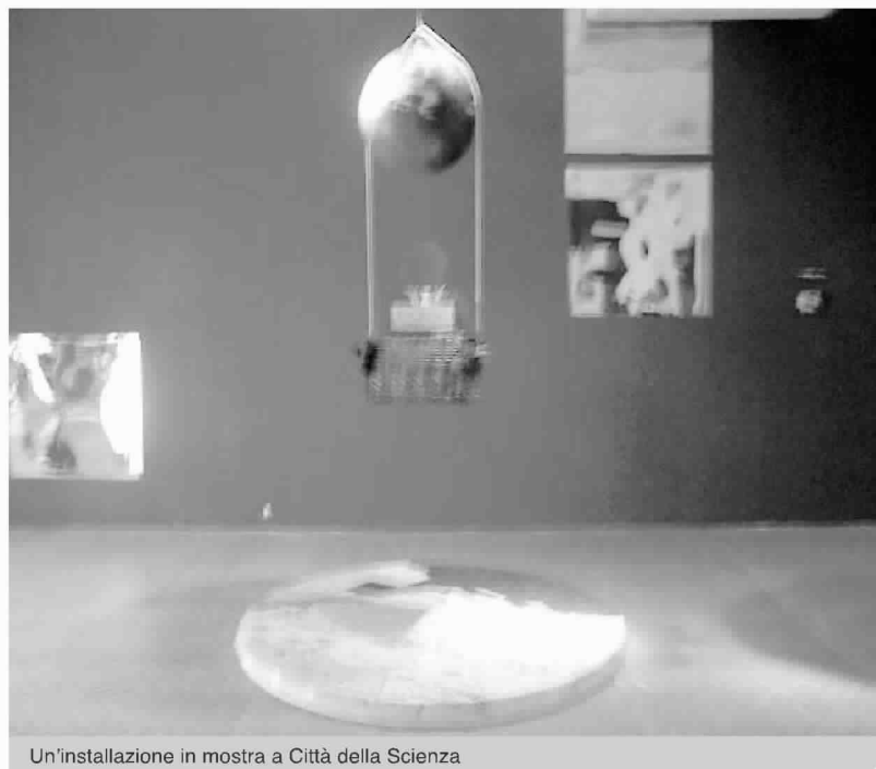
Un'installazione in mostra a Città della Scienza

alle relazioni esterne; dall'unione tali traguardi europei. E poi anco-