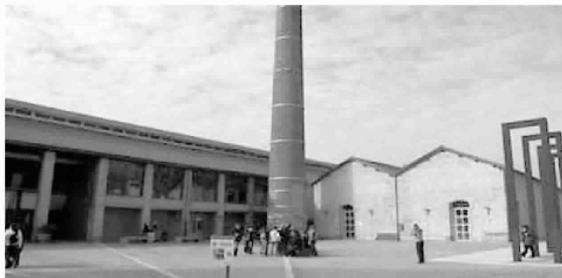
Città della scienza. In basso, il logo della Festa dell'Europa