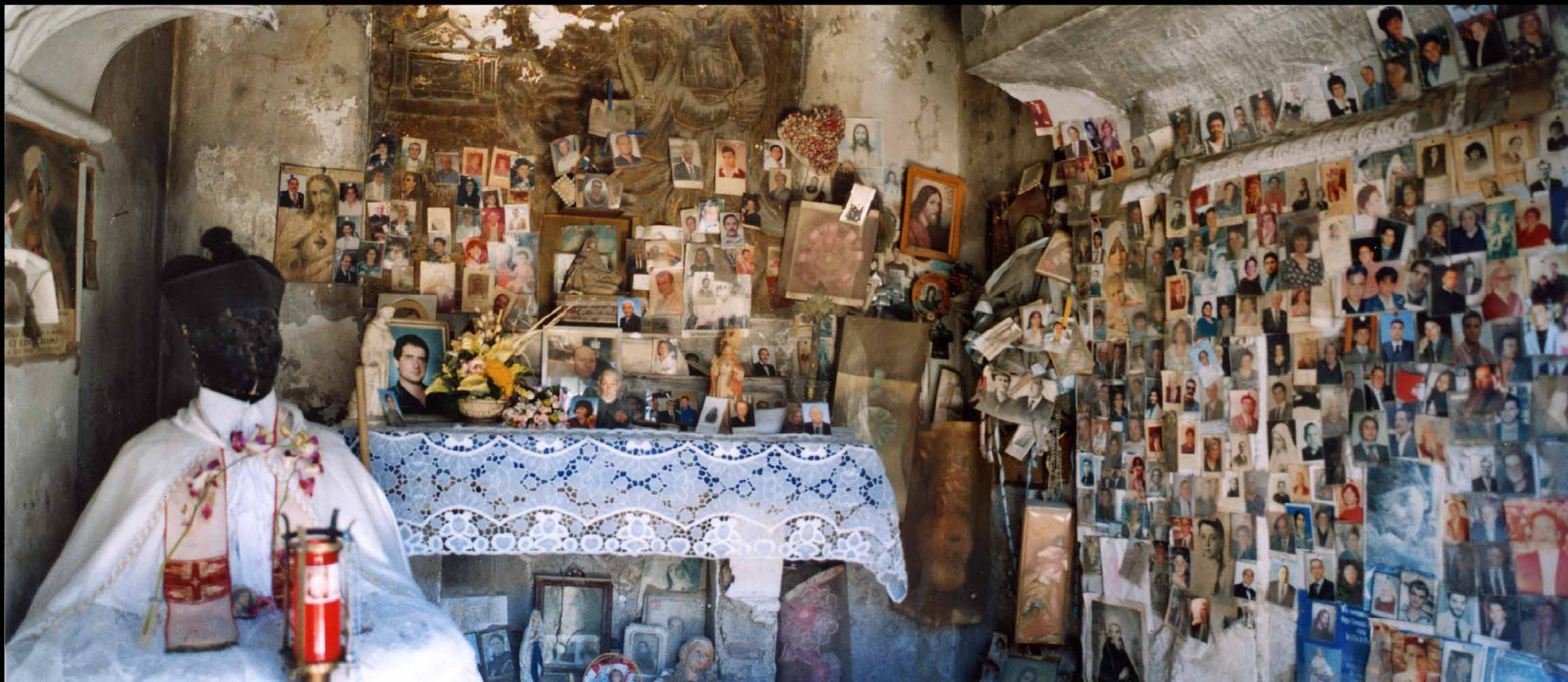
6.d.8.3. Cimitero di MIANO IMMAGINI FOTOGRAFICHE