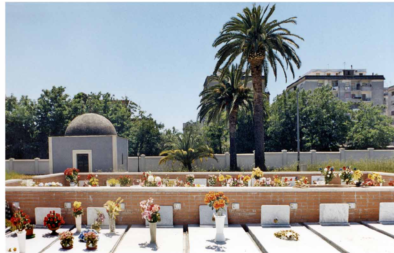
6.d.8.4. Cimitero di MIANO IMMAGINI FOTOGRAFICHE