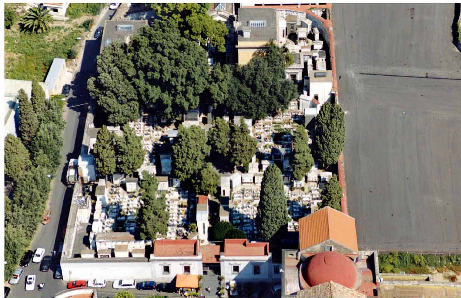
6.d.7.2. Cimitero di MIANO IMMAGINI FOTOGRAFICHE AEREE