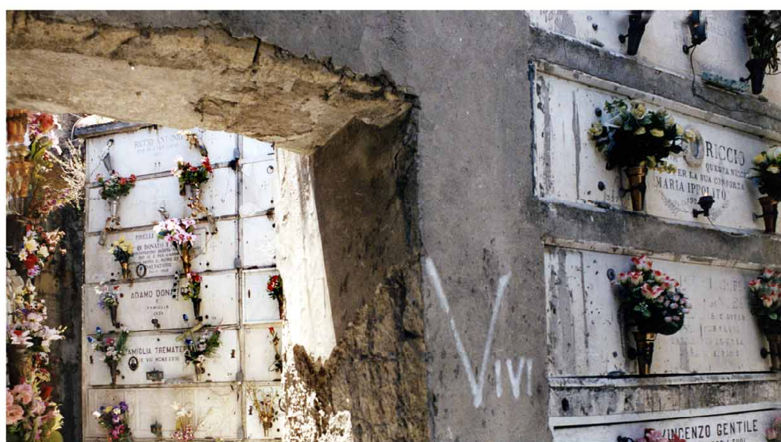
6.d.8.2. Cimitero di MIANO IMMAGINI FOTOGRAFICHE