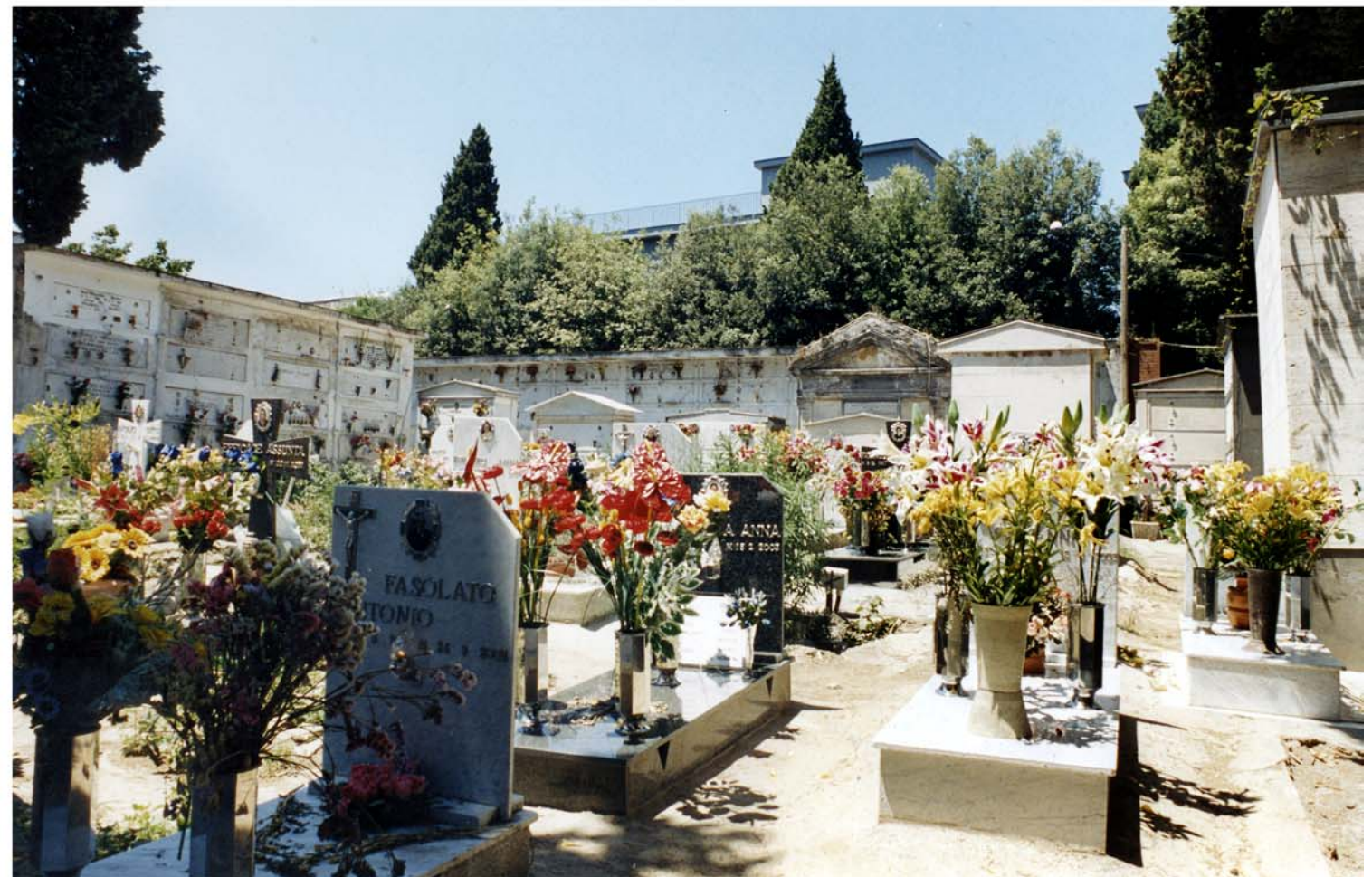
6.d.8.5. Cimitero di MIANO IMMAGINI FOTOGRAFICHE