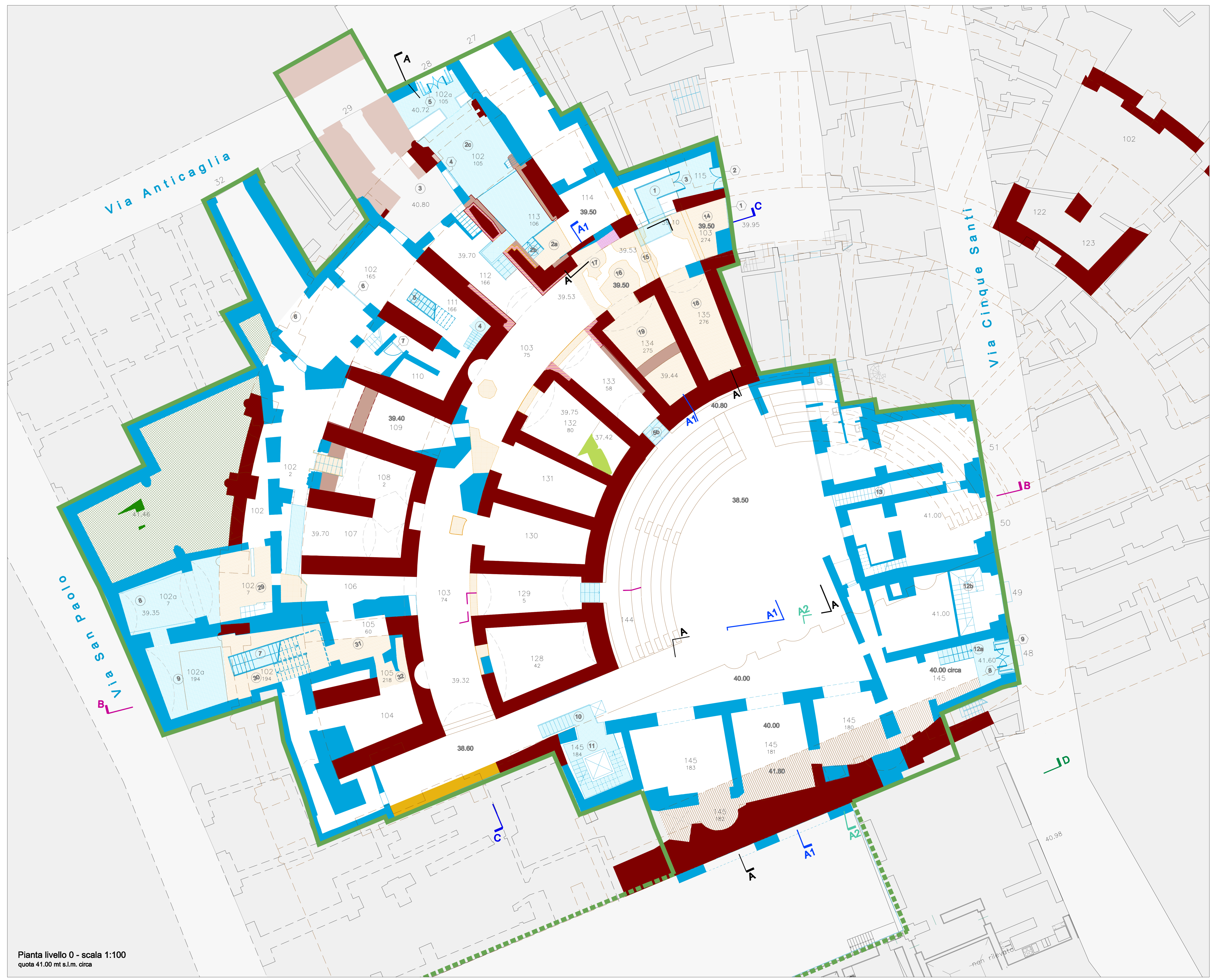
Pianta livello 0 - scala 1:100 quota 41.00 mt s.l.m. circa