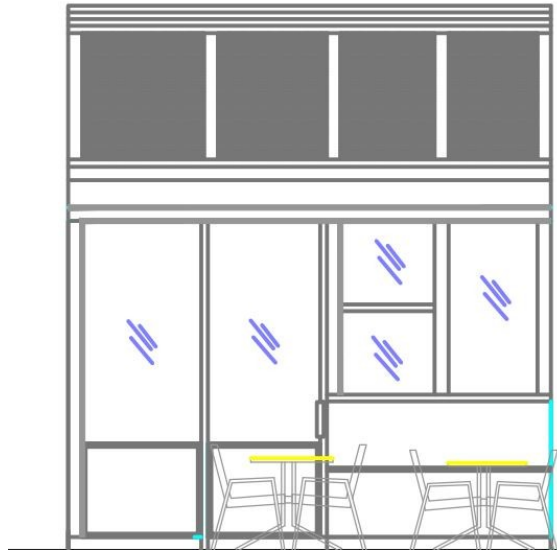
Vista Prospettica arredi scala 1:100