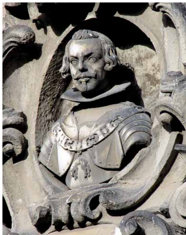
In alto: Il viceré don Pedro Antonio de Aragón in una stampa del 1671