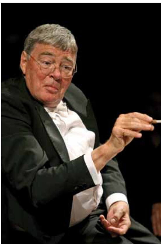
Il direttore d'orchestra Jeffrey Tate

«Le istituzioni – ha dichiarato il primo cittadino – puntano sul San Carlo perché è uno dei luoghi simbolo dell'Italia nel mondo. In questo momento storico, riuscire a dirottare risorse economiche per le Amministrazioni locali verso questo Teatro non è stato facile, ma lo abbiamo fortemente voluto, come unanimemente abbiamo voluto rilanciare il ballo e rafforzare per farlo vivere in tutta la sua autonomia. Altra sfida