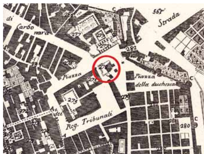
In basso: L'antica collocazione della fontana al largo del Formello, particolare da una mappa del XVIII secolo

Vicende dell'antica fontana del Formello a Capuana