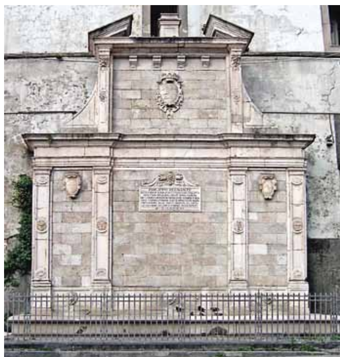
In alto: La fontana del Formello, recentemente restaurata

I restyling successivi non si limitarono a rimetterla in funzione. Ampliata e arricchita «di vaghi e nobili marmi», divenne l'elemento scenografico di rilievo nel largo demarcato dall'antico castello (poi palazzo della Gran Corte della Vicaria), dalla chiesa di Santa Caterina e dalla poderosa porta di Capuana.