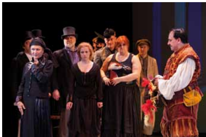
Una scena da "La bisbetica domata"

Si prosegue con Ismael Ivo che ha realizzato uno spettacolo di danza ripreso dall'universo di Yukio Mishima , fino al dramma di Antonio e Cleopatra , spettacolo di Luca De Fusco , direttore del Festival, che ha avuto il merito di sperimentare e mescolare i luoghi e la tradizione della cultura del teatro napoletano e internazionale con le nuove correnti che si affacciano sulla scena, caratterizzate, in questo contesto, dal Fringe Festival , spazio riservato interamente alle nuove leve del teatro.