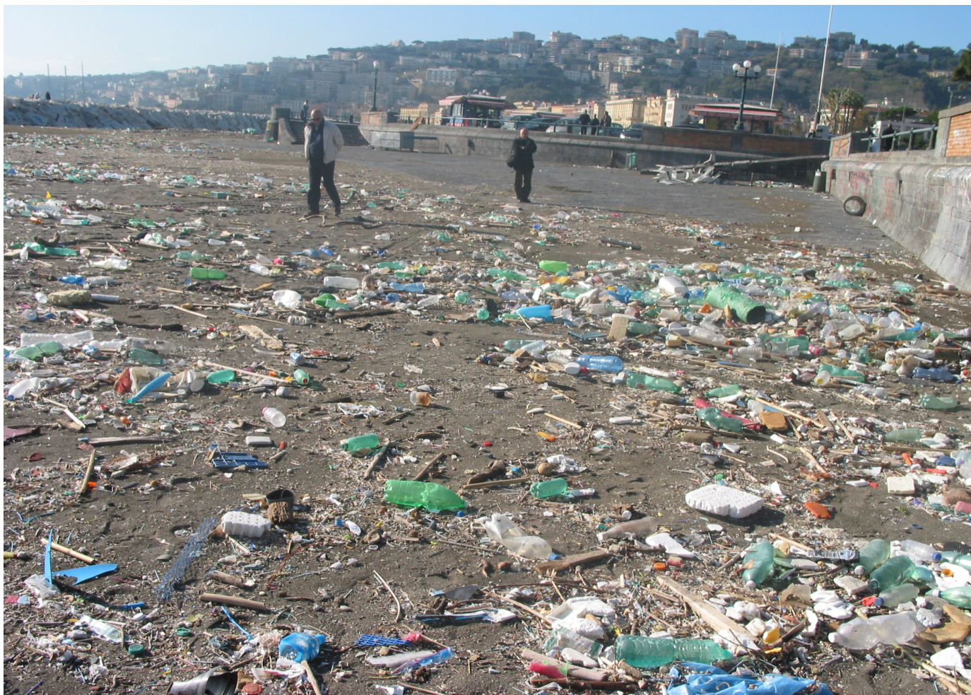
Arenile Rotonda Diaz - rifiuti spiaggiati dalla mareggiata del 29/10/2018.