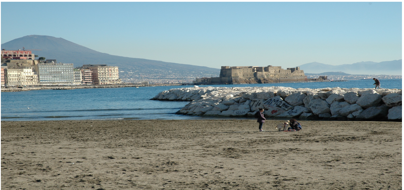
14 Novembre 2018 Arenile Rotonda Diaz - " Estate di S.Martino "

Nella parte centrale del mese le temperature miti ed il cielo sereno non hanno smentito la cosiddetta estate di S. Martino ( 10 - 15 Novembre ) che ha regalato alla città giornate tipicamente primaverili. La pioggia caduta è stata pari a 177 mm , il 41% in più della media stagionale.