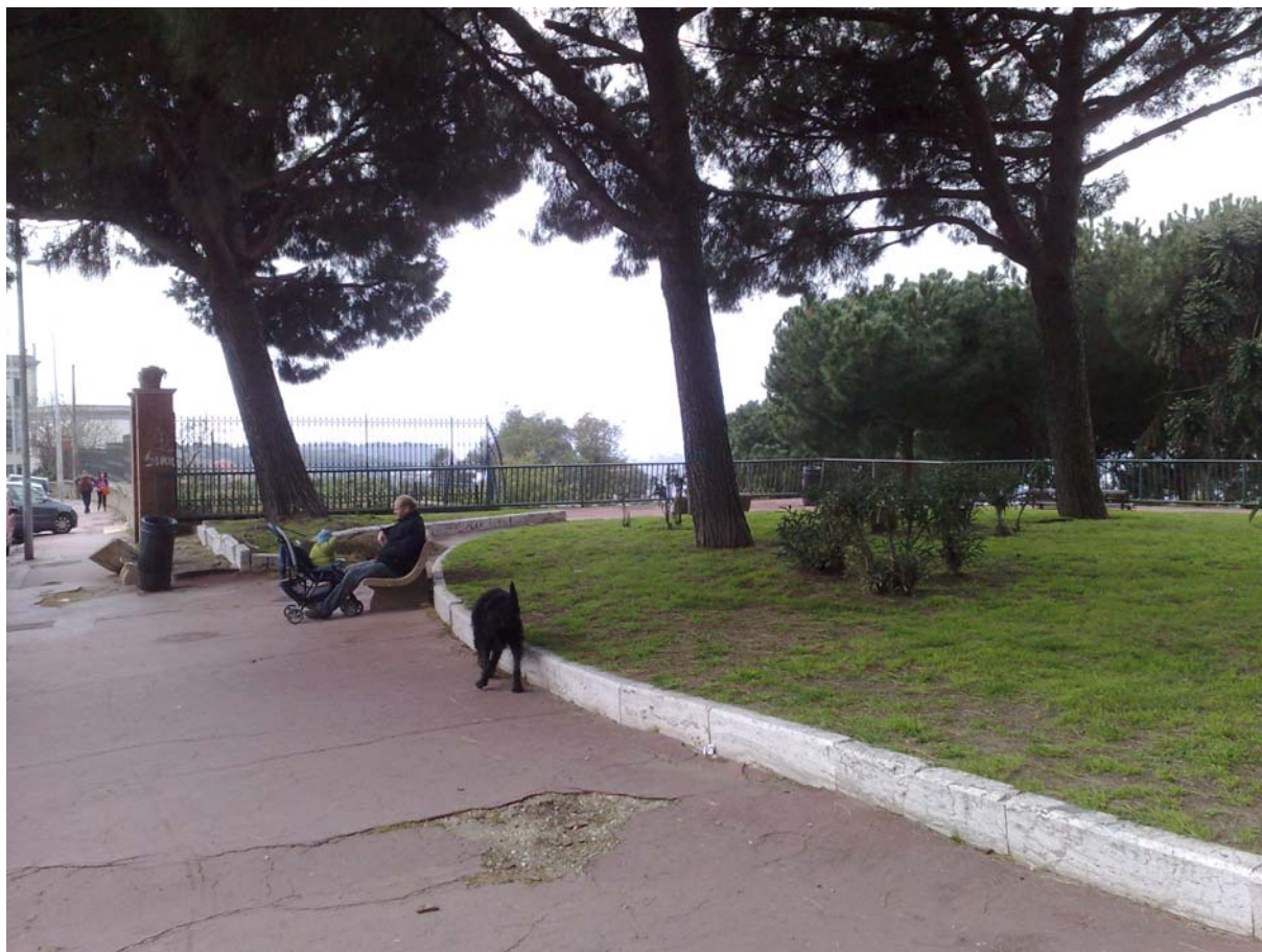
Via Manzoni, area belvedere