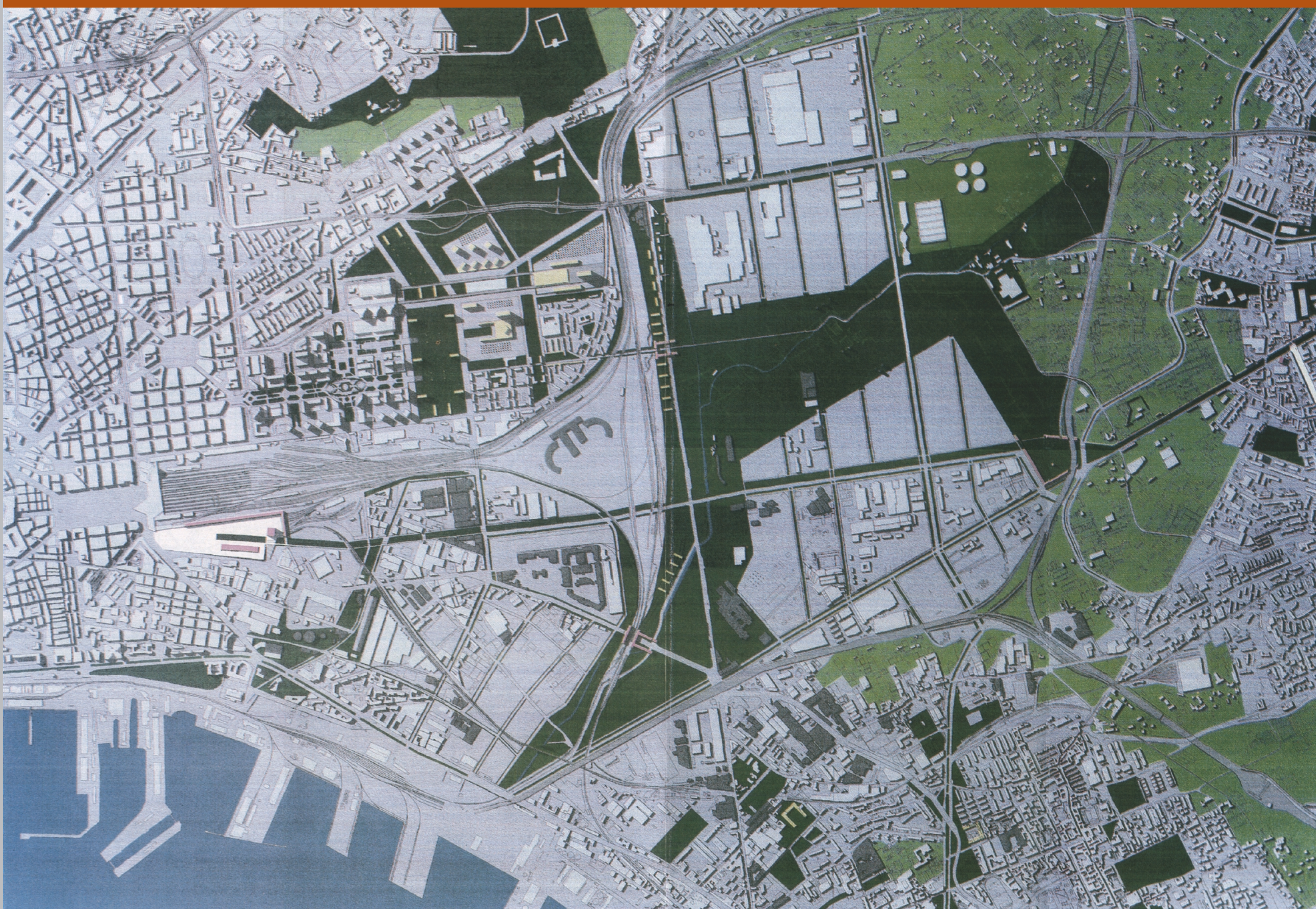
Panoramica della zona orientale