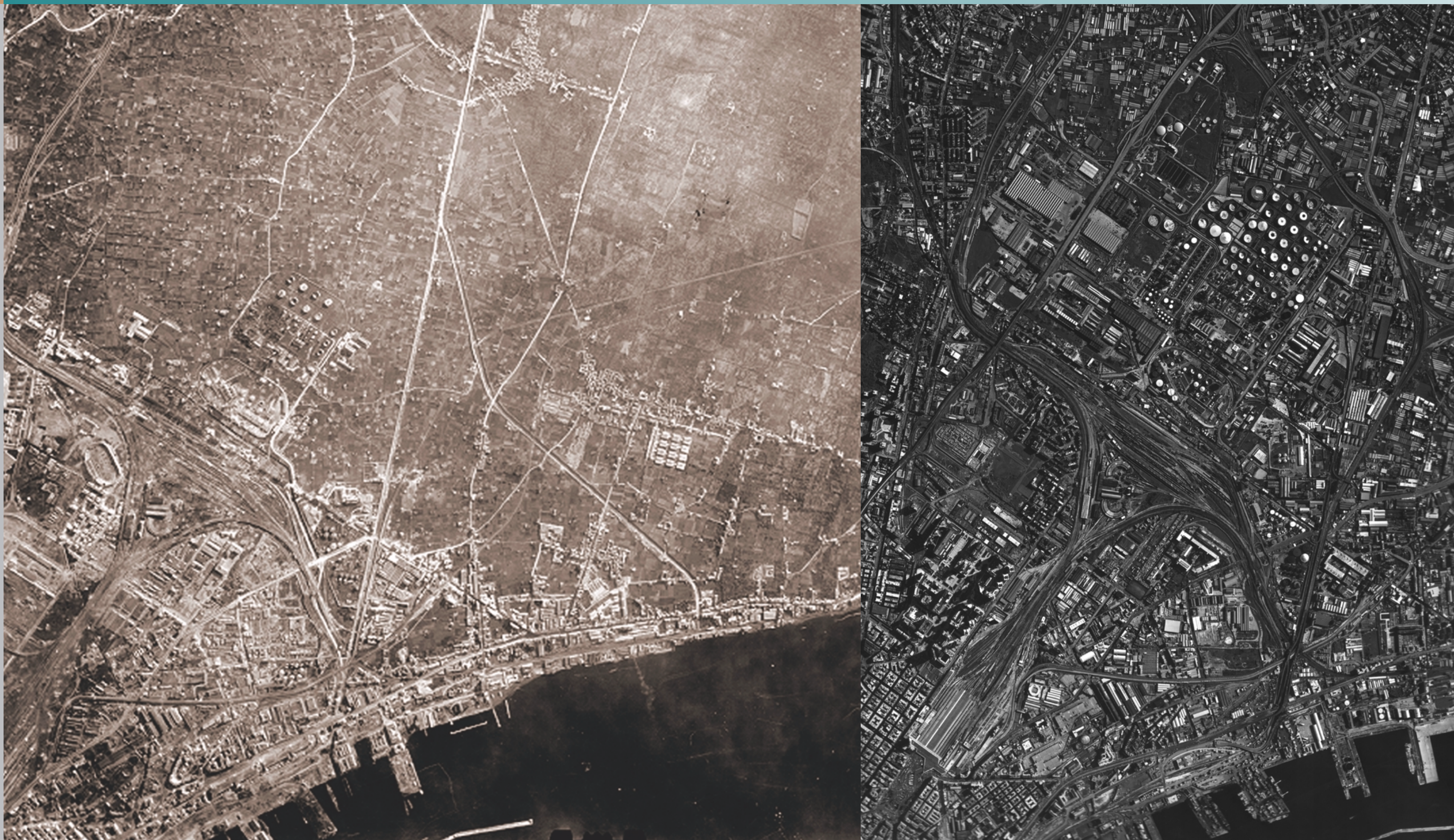
L'area in foto zenitali del 1943 e del 1996; sulla destra, dall'alto in basso: l'incendio dell'AGIP del 1985, il corso del Fosso Reale, un capannone della Montecatini, veduta aerea dell'area delle raffinerie

Variante al prg per il centro storico, la zona orientale, la zona nord-occidentale Assessorato alla vivibilità, servizio pianificazione urbanistica