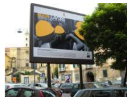
Via Carbonara antistante civ 117