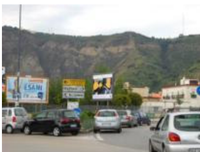
Via Pigna altezza rotonda Epomeo