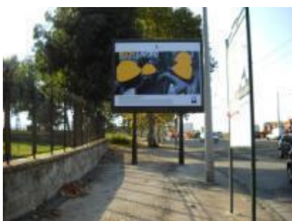
Via Don Bosco 200 mt prima incrocio via De Giaxa