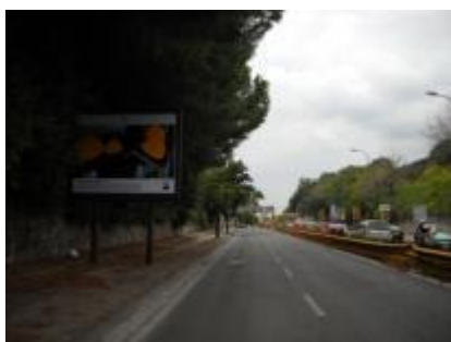
Via Beccadelli 150 mt dopo V. Provinciale S. Gennaro