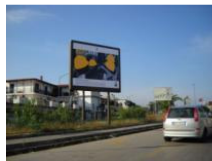
Via Oreste Salomone aiuola fr via del riposo