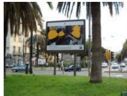
Piazza Carlo III fr via Foria