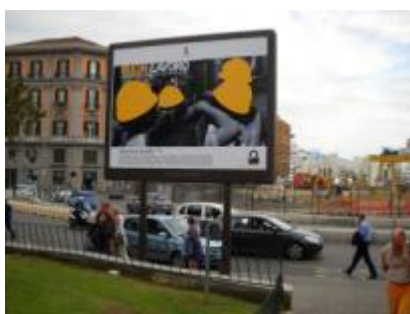
P.za Municipio su spartitraffico retro Taxi