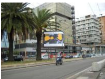
Via Marina fr facoltà giurisprudenza