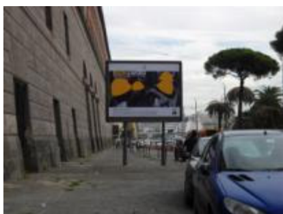
Via Acton fr. semaforo