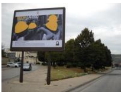
Via Terracina, ang. Via Cinta, ALT. P.L.1630201020304