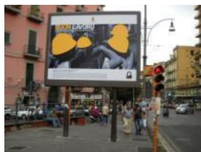
Via Foria ang. P.za Cavour