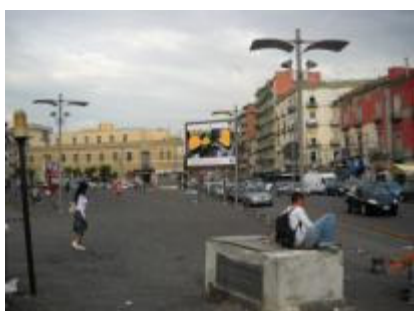
Piazza Leone angolo Capuana