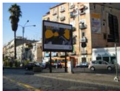
P.za Ottocalli su spartitraffico centrale