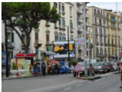
Via Piedigrotta ang. G. Bruno retro Esso

25 TELI RETROILLUMINATI. PROGRAMMATI DAL 14 SETTEMBRE 2009 PER 40 GG.