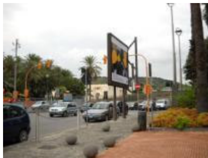
Piazzale Tecchio fr Fabio Massimo