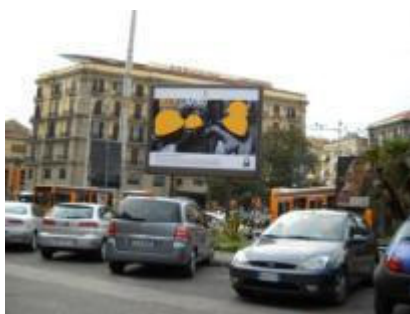
Piazza Garibaldi Fr Corso Umberto