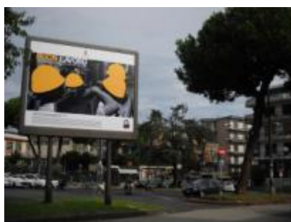
Piazza Europa aiuola