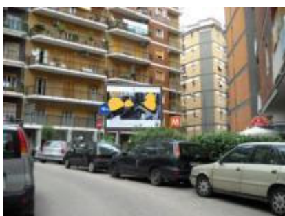
Via Palermo, aiuola antistante ingresso Metro