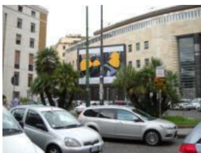
Piazza Matteotti fr Posta centrale