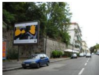
Via Coroglio, sotto il ponte, a sinistra