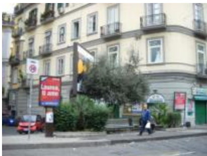
Piazza degli Artisti