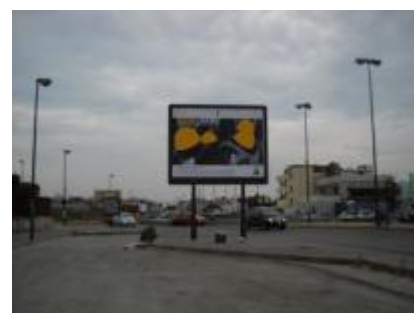
Via Argine ang. Via Labriola