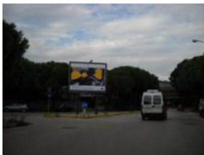
Via Cassiodoro angolo Giustiniano