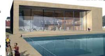
Chalet del Parco