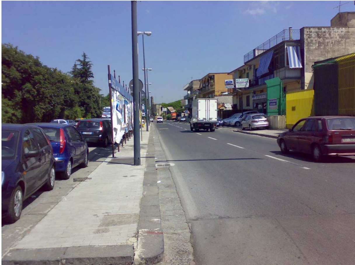
Via del Cassano, area di parcheggio