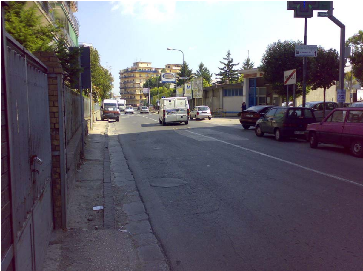
Via del Cassano

Le strade, caratterizzate da un intenso traffico veicolare, versano in condizioni di rilevante degrado che causa condizioni di pericolo e inquinamento acustico. Compito del progetto è, quindi, di restituire all'asse viario adeguati livelli di sicurezza e prestazionali per la mobilità veicolare e pedonale.