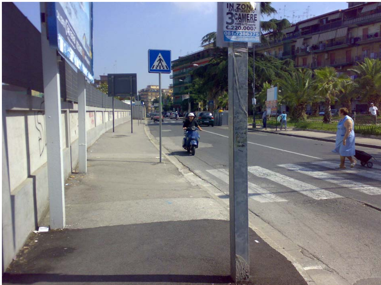
Via del Cassano

Lungo via del Cassano sono presenti diverse attività commerciali, il Cimitero con un area di parcheggio; in via Comunale Limitone il Deposito Militare e alcune attività commerciali.