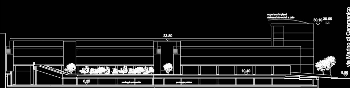
SEZIONE LONGITUDINALE SULLA PIAZZA INTERNA