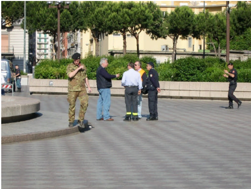
Alcuni momenti al Centro Direzionale