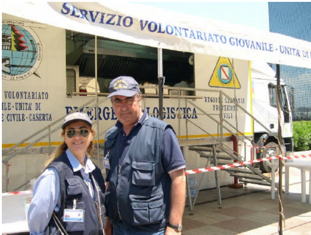
Personale della Protezione Civile Comunale presso il tir adibito a cucina mobile