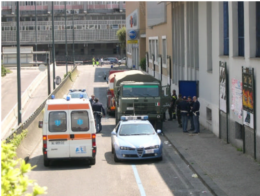
Fasi finali dell'operazione con veicoli di soccorso pronti a scortare l'autocarro dell'Esercito Italiano con a bordo l'orgigno