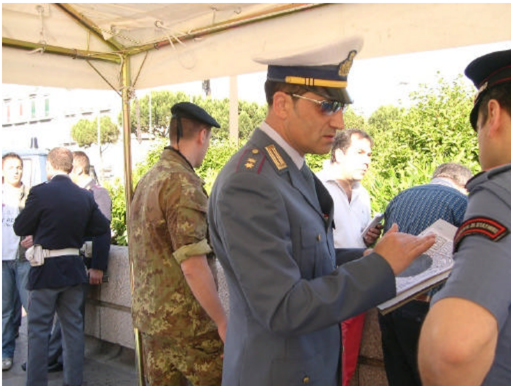
Polizia di Stato, Arma dei Carabinieri, Esercito Italiano, Polizia Locale, Asl Na1, Protezione Civile Regionale e Comunale presso il Centro Operativo e di Controllo