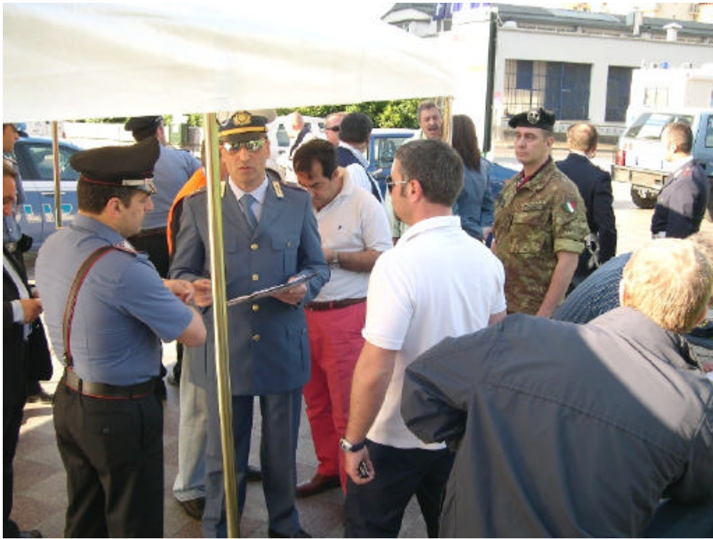
Polizia di Stato, Arma dei Carabinieri, Esercito Italiano, Polizia Locale, Asl Na1, Protezione Civile Regionale e Comunale presso il Centro Operativo e di Controllo