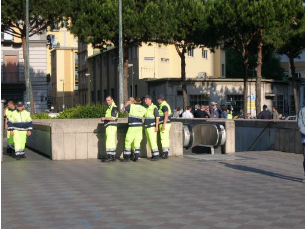
Volontari della Protezione Civile controllano dei varchi e scale-mobili al Centro Direzionale