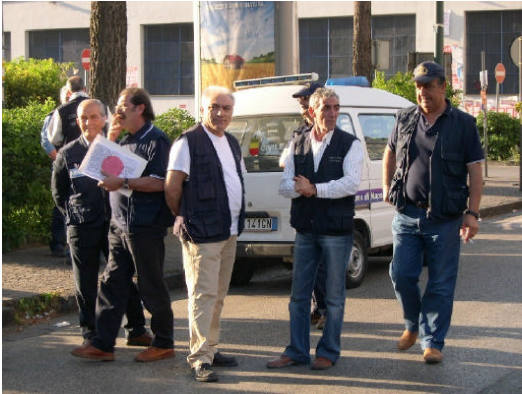
Personale della Protezione Civile Comunale si prepara ad assumere le postazioni di controllo