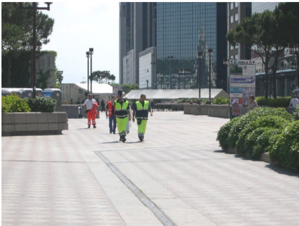
Volontari e Asl Na1 al Centro Direzionale