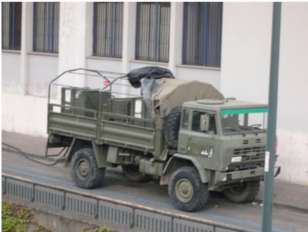
L'autocarro dell'Esercito Italiano allestito per poter trasportare l'ordigno bellico