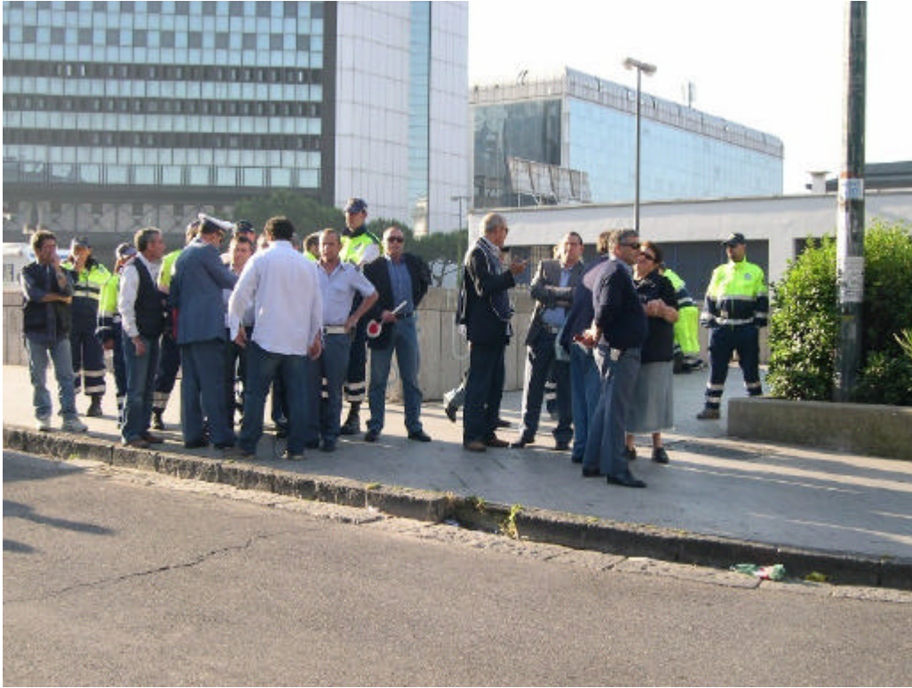
Altre forze di controllo e di Polizia sul luogo dell'evento