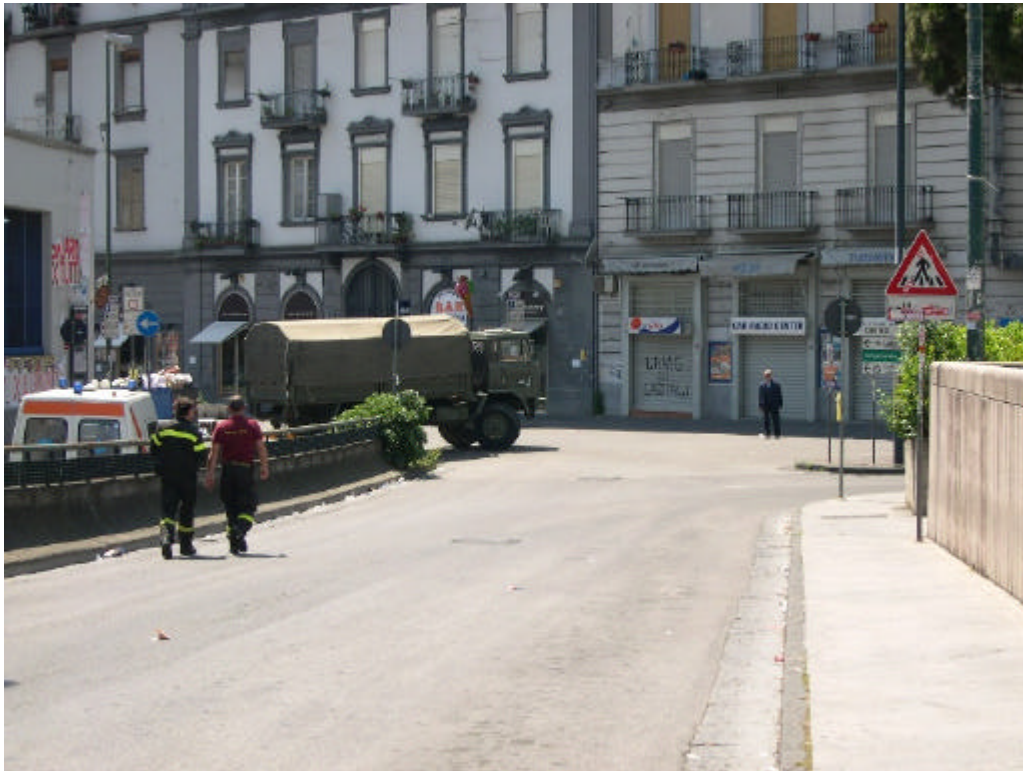
L'autocarro dell'Esercito Italiano si allontana dal posto scortato dai veicoli di soccorso