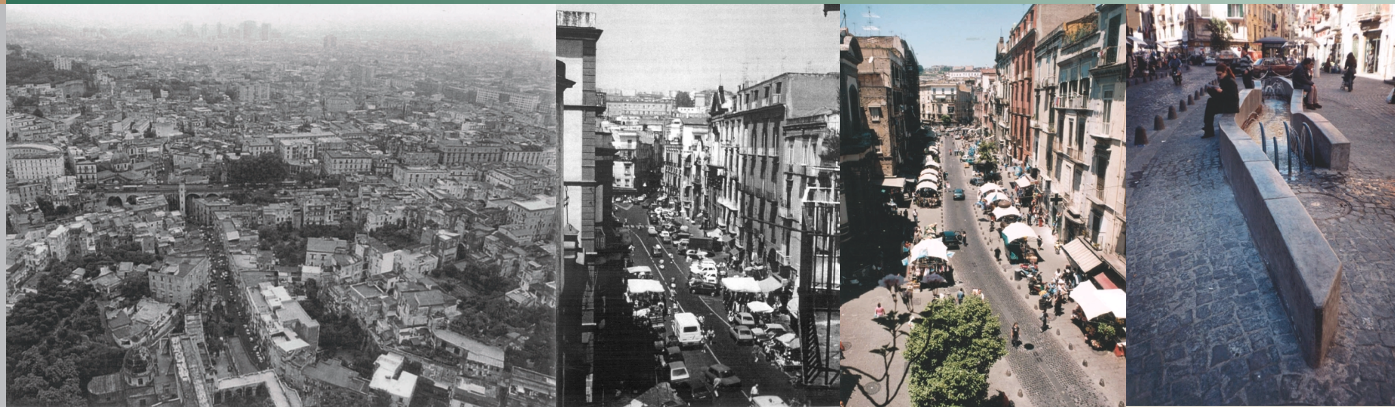
Da sinistra a destra: panoramica della Sanità, largo dei Vergini, prima e dopo l'intervento e la nuova fontana nella via riqualficata

Sanità-Programma Urban Assessorati alla dignità e alla vivibilità, servizio interventi centro storico