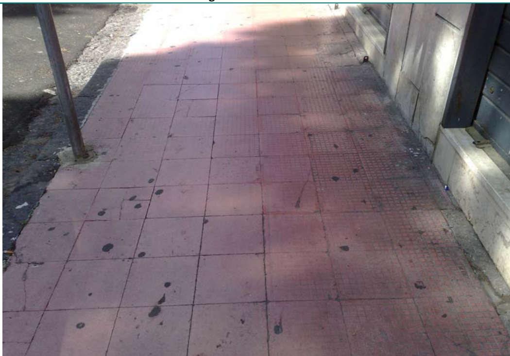
Via Nicolardi: marciapiedi degradati