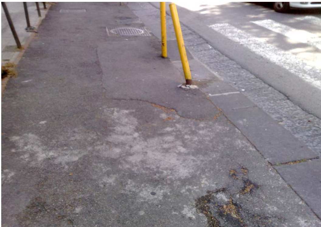
Via Colli Aminei: Capostrada e marciapiedi in conglomerato bituminoso

I marciapiedi di via Nicolardi e via Colli Aminei, di larghezza variabile, non presentano particolari aspetti decorativi, e sono caratterizzati, nella prima, da una pavimentazione in conglomerato bituminoso, in mattonelle di asfalto e di cemento, nella seconda da una pavimentazione in conglomerato bituminoso.