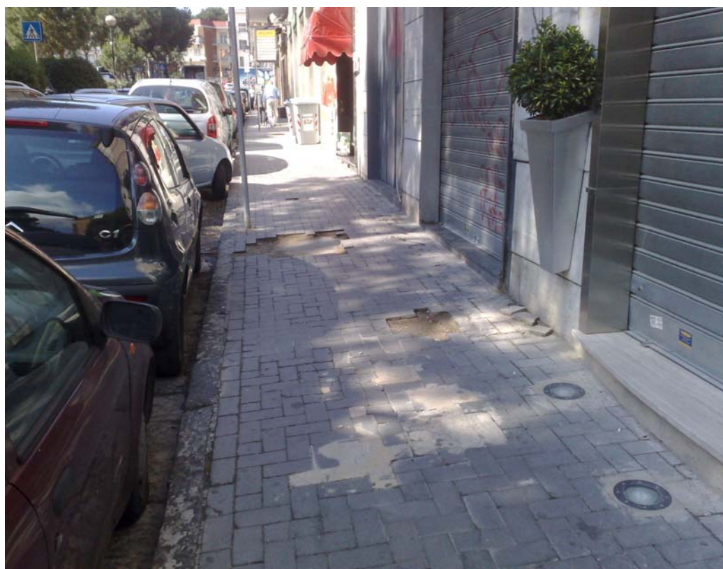
Via Nicolardi: marciapiedi degradati