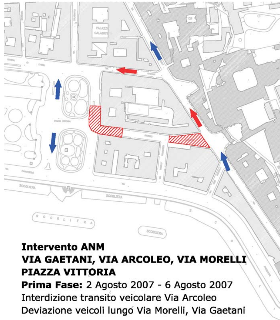
Intervento ANM VIA GAETANI, VIA ARCOLEO, VIA MORELLI PIAZZA VITTORIA Prima Fase: 2 Agosto 2007 - 6 Agosto 2007 Interdizione transito veicolare Via Arcoleo Deviazione veicoli lungo Via Morelli, Via Gaetani