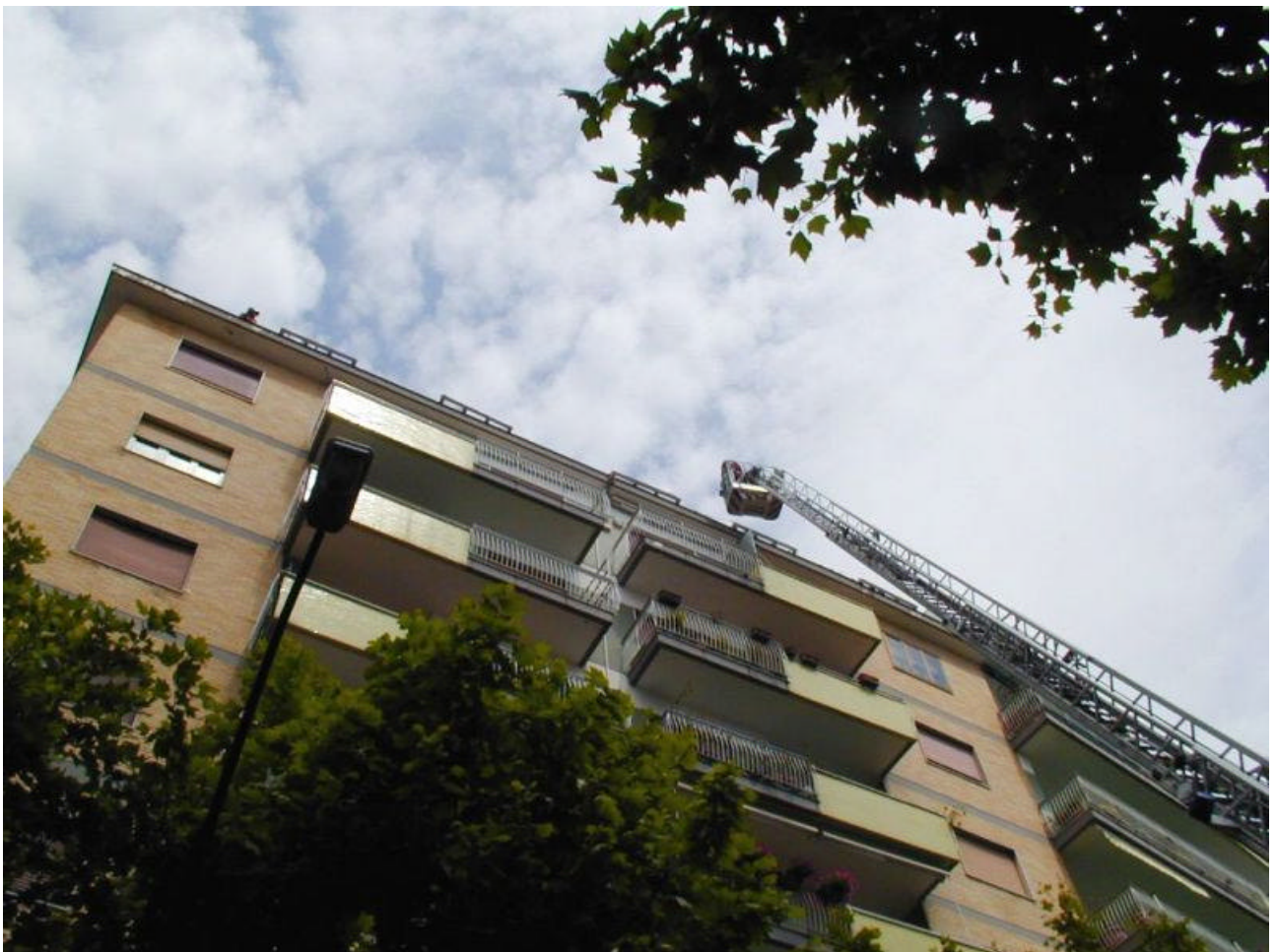
Scala-cestello VVF in azione