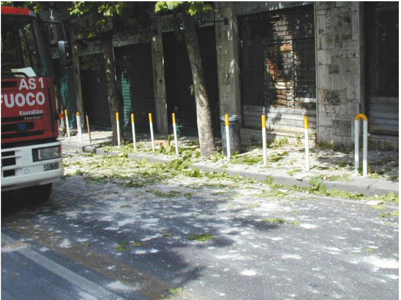
Calcinacci e detriti in Via Bernardo Cavallino