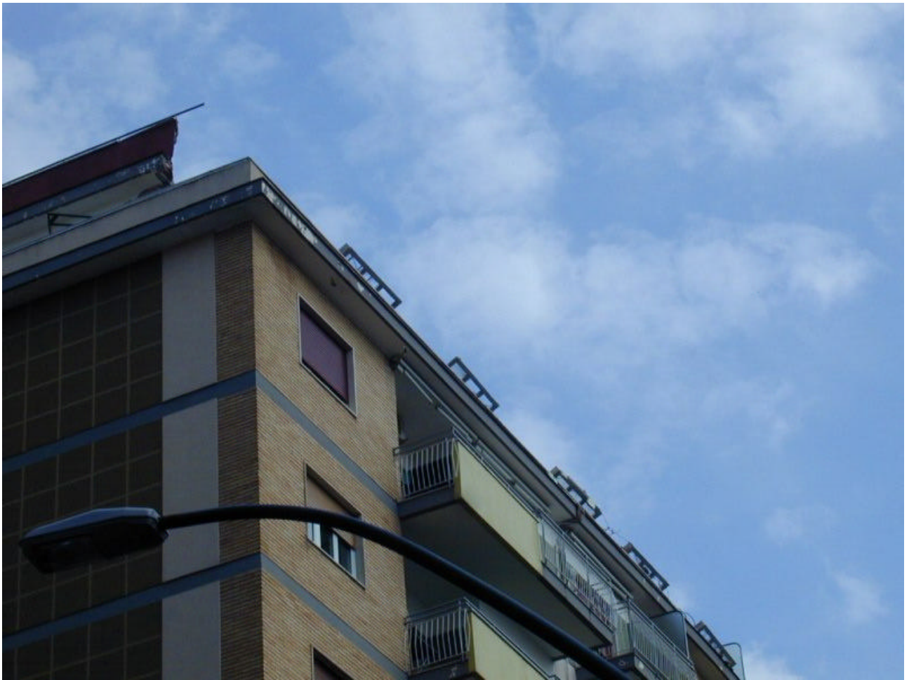
Vista d'insieme dei danni