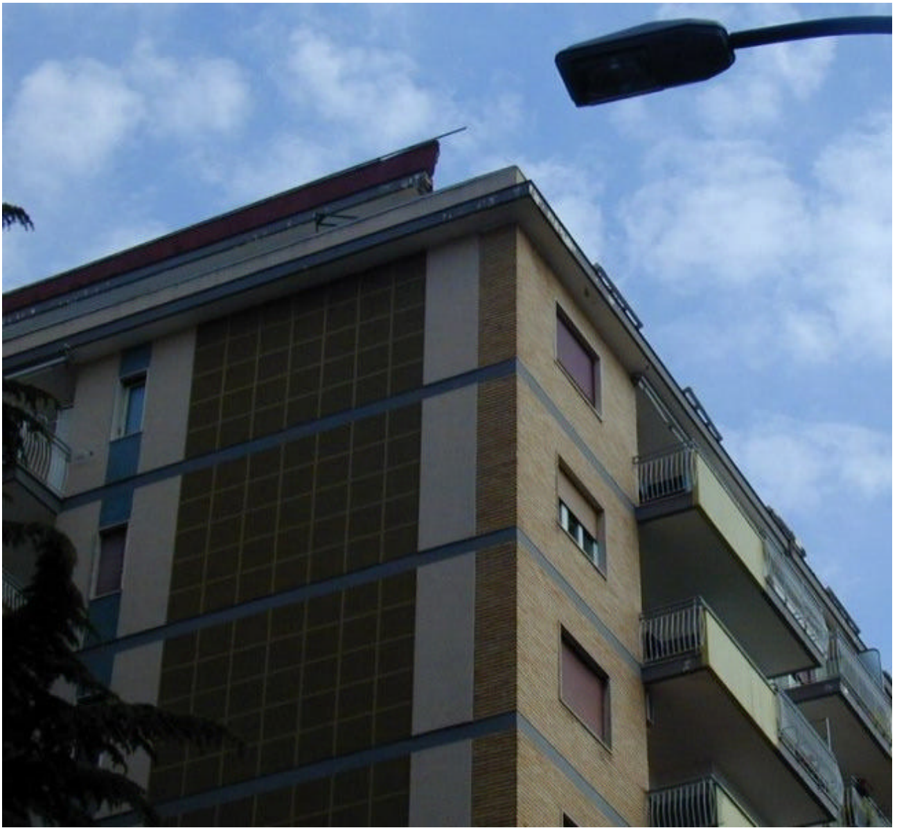
Parte dei danni alla sommità dell'edificio