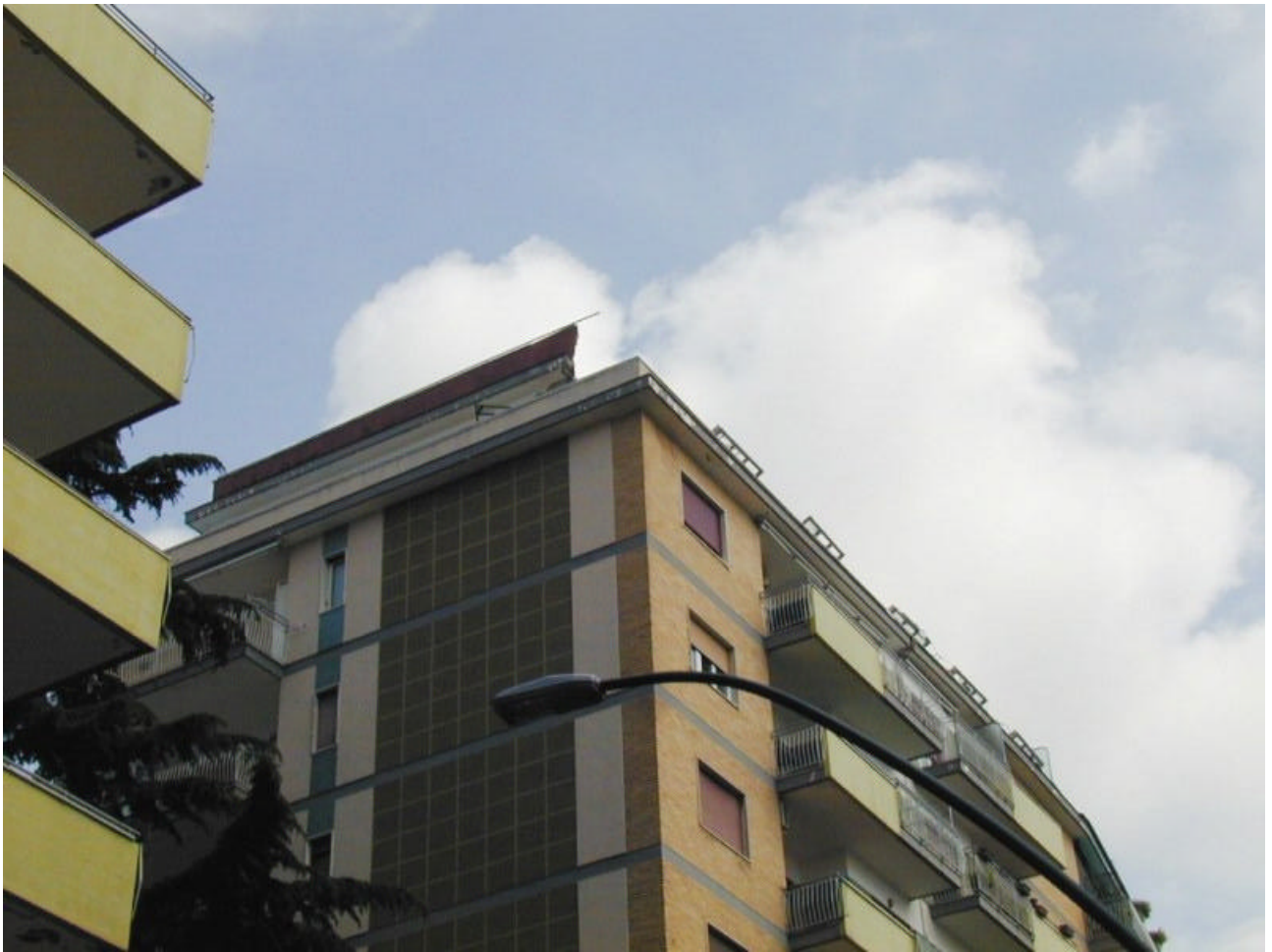
Foto d'insieme dei danni visibili dal basso