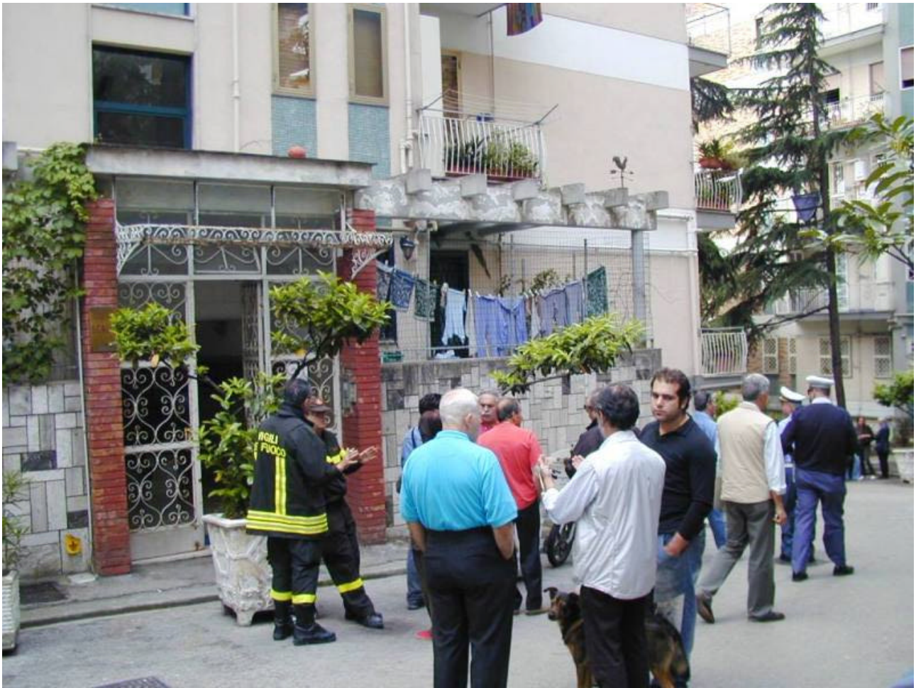
Abitanti allontanati dai VVF