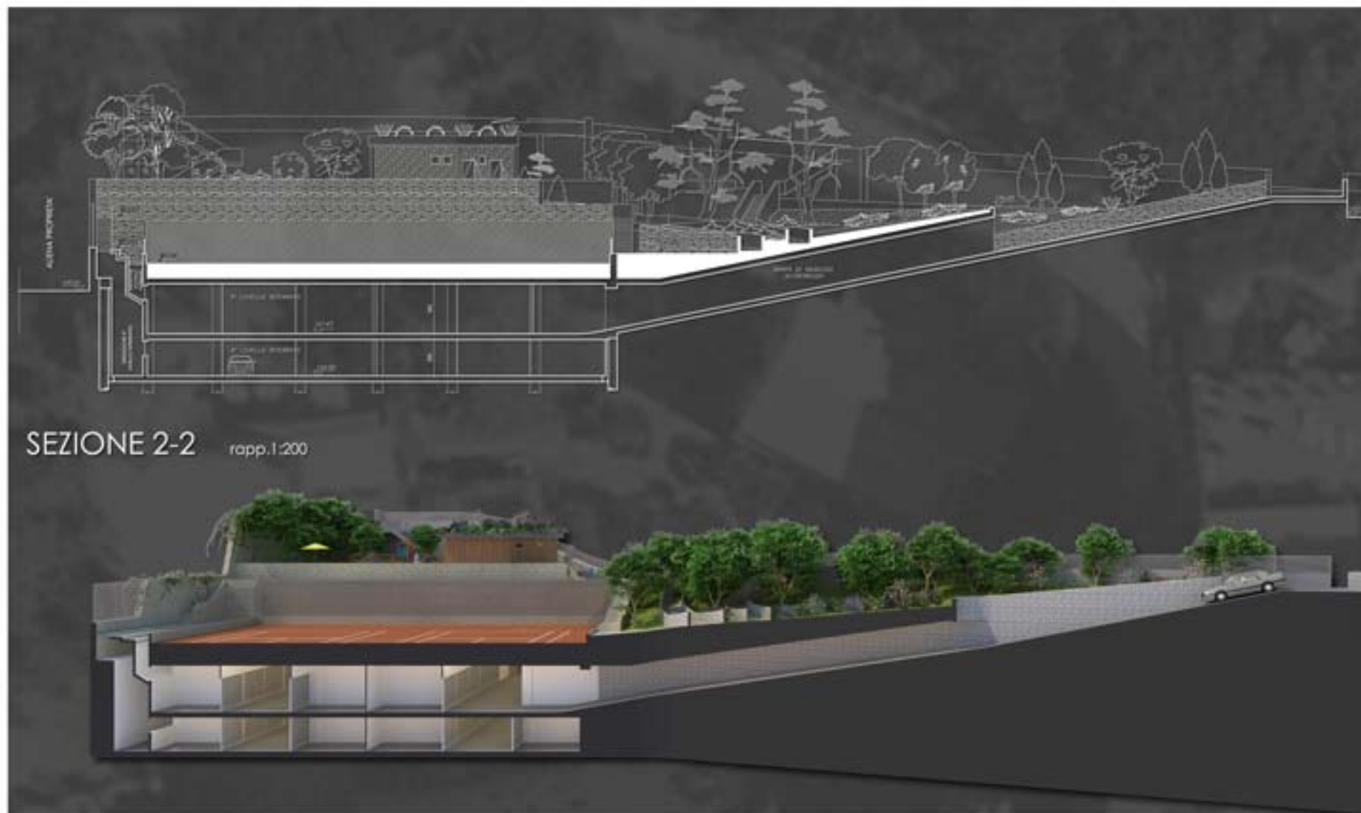
fig. 4 vista da sud della sezione ovest-est dell'impianto finito