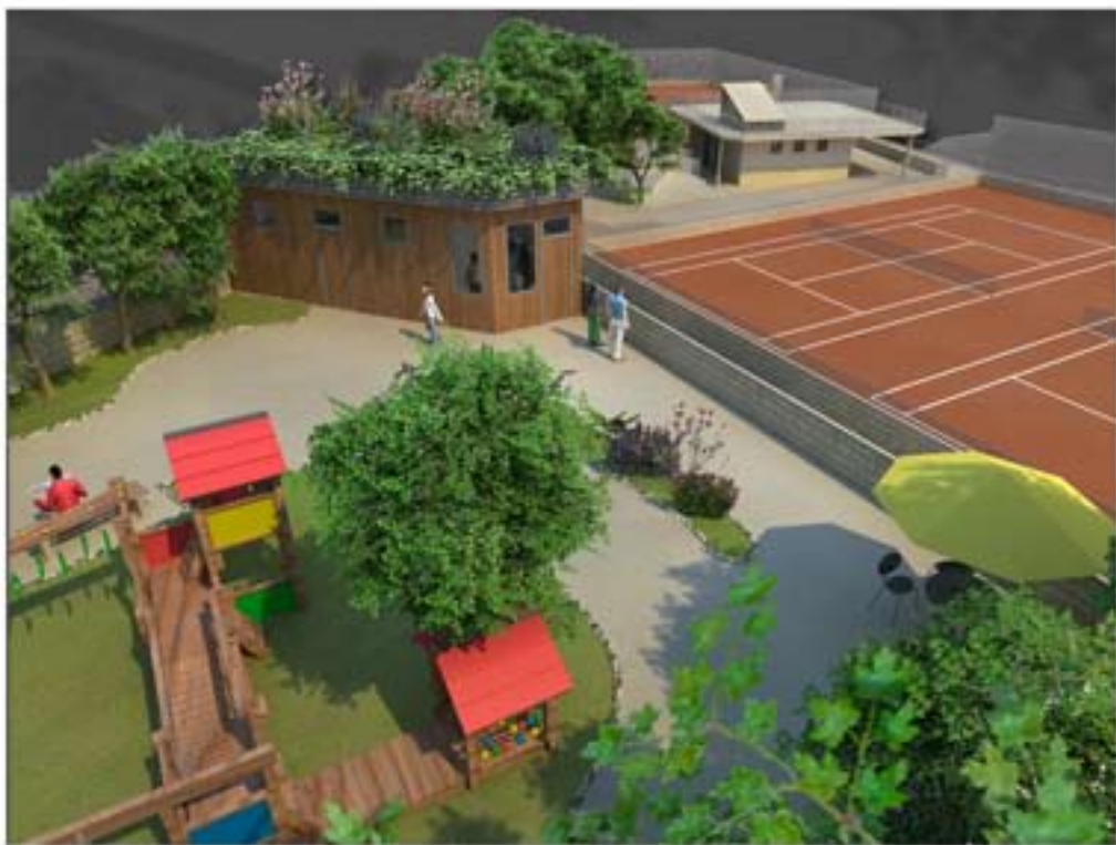
figg. 5 e 6 elaborazioni digitali di particolari del progetto finito