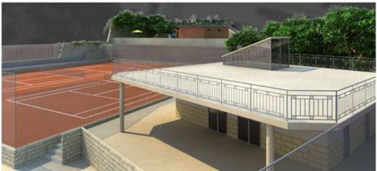
figg. 7, 8 e 9 elaborazioni digitali di particolari del progetto finito