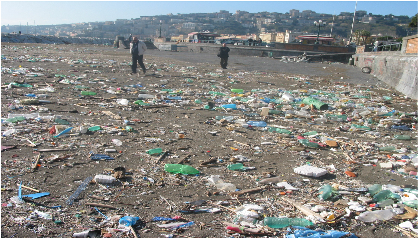
Arenile Rotonda Diaz - rifiuti spiaggiati dalla mareggiata del 29/10/2018.