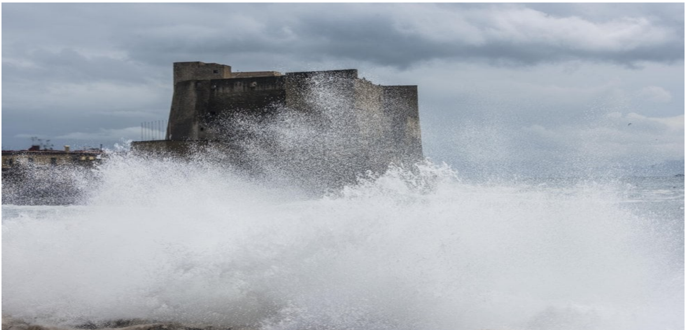
Castel dell'Ovo - burrasca di scirocco del 29 Ottobre.

Le piogge sono state pari a 136 mm , 13 mm in più di quanto piove normalmente nel mese.