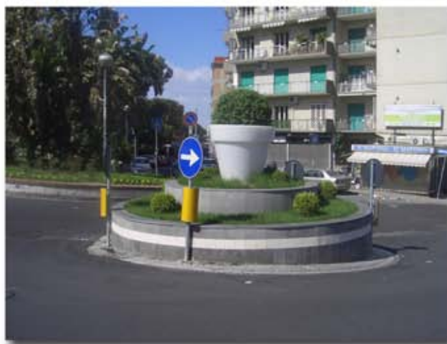
Rotonda dei Colli Aminei