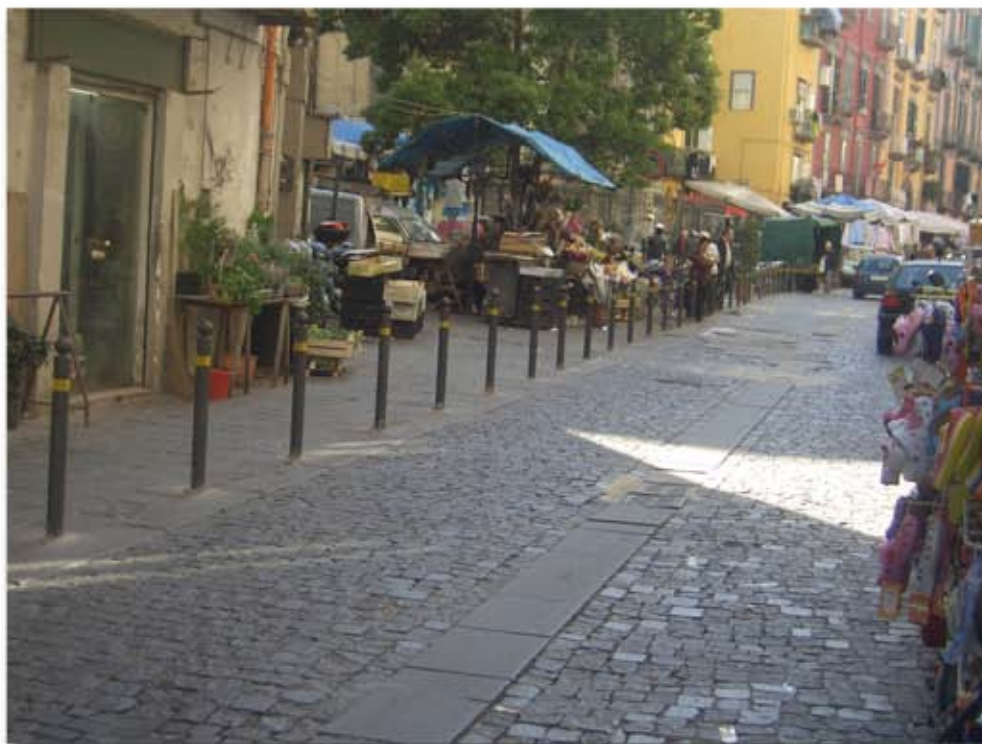
Interventi di riqualificazione e palettizzazione di via Vergine