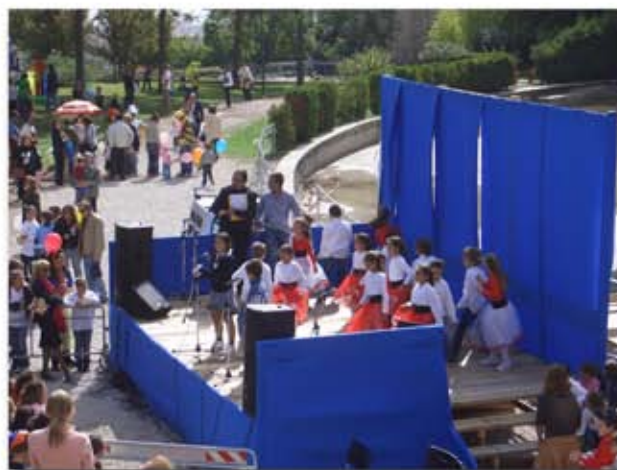
"La Città dei Bambini"