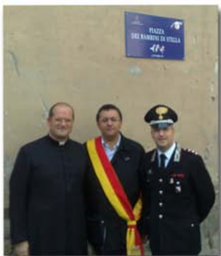
Pedonalizzazione Piazzetta Stella