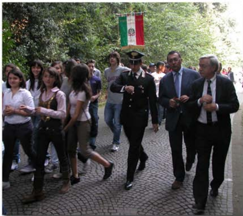
Le giornate di Capodimonte