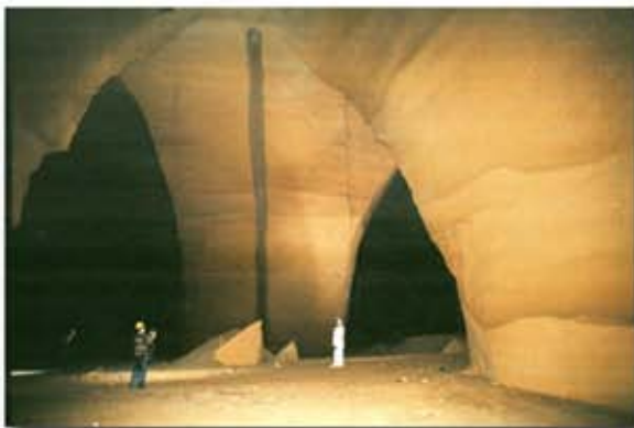
Lavori di riempimento per la messa in sicurezza della cava