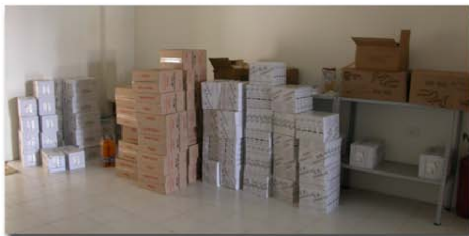
Banco Alimentare per l'assistenza di famiglie disagiate

I Nonni Civici hanno dato la possibilità ad anziani di svolgere un ruolo socialmente utile e importante, come ad esempio la vigilanza fuori le scuole per l'attraversamento pedonale dei minori e la loro tutela.