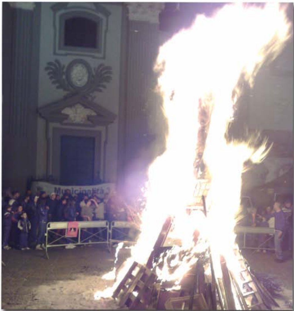
"Rito dei Fuochi" alla Sanità

Tra gli appuntamenti più caratteristici ci sono state le edizioni del Carnevale alla Sanità , ai Colli Aminei e nel quartiere San Carlo , realizzati dopo aver coinvolto i bimbi delle scuole e dei centri di educazione in laboratori creativi. Tante sono state le manifestazioni suggestive occasione di festa per la cittadinanza e folclore turistico, tra queste: la sfilata Tricolore in occasione dell'anniversario dell'unità d'Italia e ancora il Falò alla Sanità per la festa di Sant'Antonio del 17 gennaio, che si è svolta dando luogo allo spettacolare 'Rito dei Fuochi'.