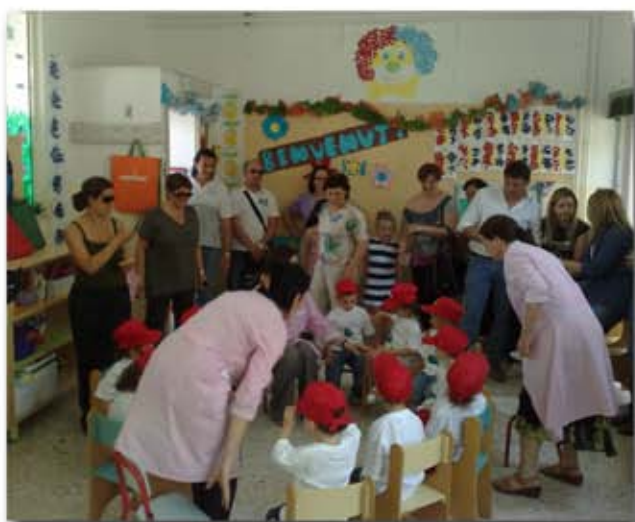
Scuole in festa

Iniziative realizzate dalla Municipalità in collaborazione con i Vigili del Fuoco e la Polizia Municipale all'interno del Bosco di Capodimonte, per insegnare ai piccoli, attraverso giochi di gruppo e gare, le regole della sicurezza stradale. La Municipalità ha distribuito nelle scuole, il volume 'La strada ci insegna' , realizzato dall'associazione 'Asso è', per imparare, colorando, come ci si comporta in strada.