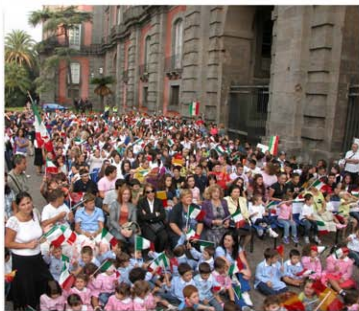
Celebrazione delle "Quattro Giornate" a Capodimonte