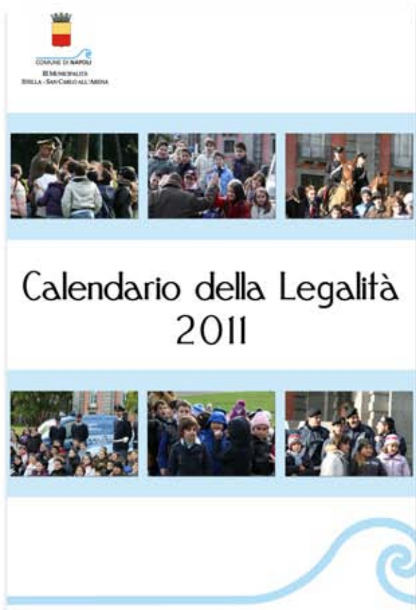
Calendario della Legalità 2011

Momenti festosi ed educativi che hanno coinvolto i bambini delle scuole del territorio con lezioni, incontri e appuntamenti ludico-formativi all'interno del bosco di Capodimonte insieme ai vari rappresentanti delle forze dell'ordine. Per celebrare l'importanza delle Giornate della Legalità e del loro significato, la municipalità con il patrocinio del Comune di Napoli ha realizzato il Calendario della Legalità , distribuito nelle scuole partenopee. Il calendario realizzato nello splendido scenario del bosco di Capodimonte, raffigura i 12 mesi nelle immagini che ritraggono i bimbi delle varie scuole e del Centro di Prima Accoglienza 'Don Pepe Diana' con i rappresentanti della Polizia di Stato, dell'Arma dei Carabinieri, della Guardia di Finanza, della Polizia Municipale e del Corpo Militare della Croce Rossa Italiana.