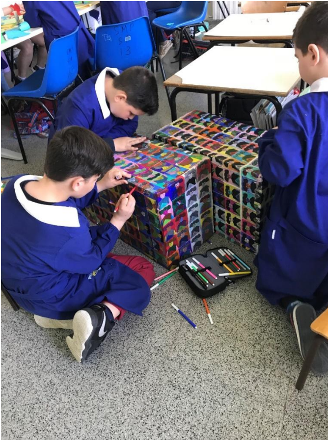
Laboratorio in classe