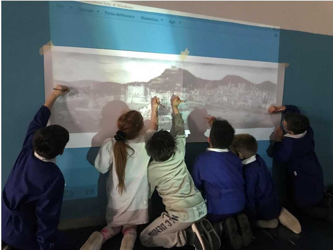
Laboratorio in classe