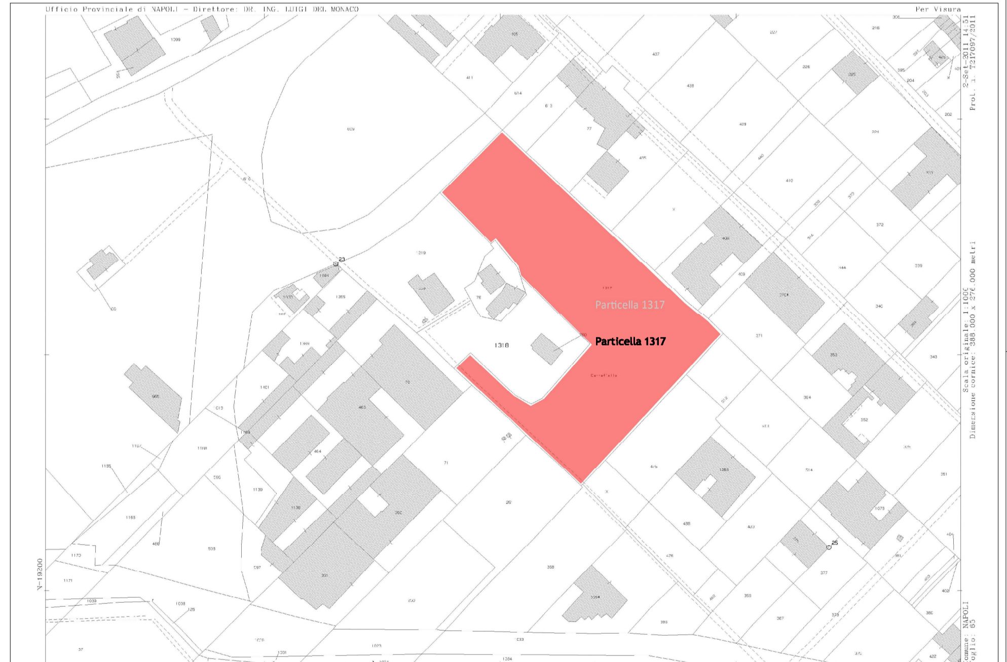
Planimetria catastale - C.T Fgl.65 p.la 1317

COMUNE DI NAPOLI Dipartimento di pianificazione urbana Intervento per la realizzazione di un'attrezzatura sportiva assoggettata ad uso pubblico in Napoli a Via De Chirico n.16 Municipalità IX - Quartiere Pianura Intervento da realizzare ai sensi della V.G. PRG Comune di Napoli art.56 c.III Delibera di G.C. n.1882 del 23.03.2006