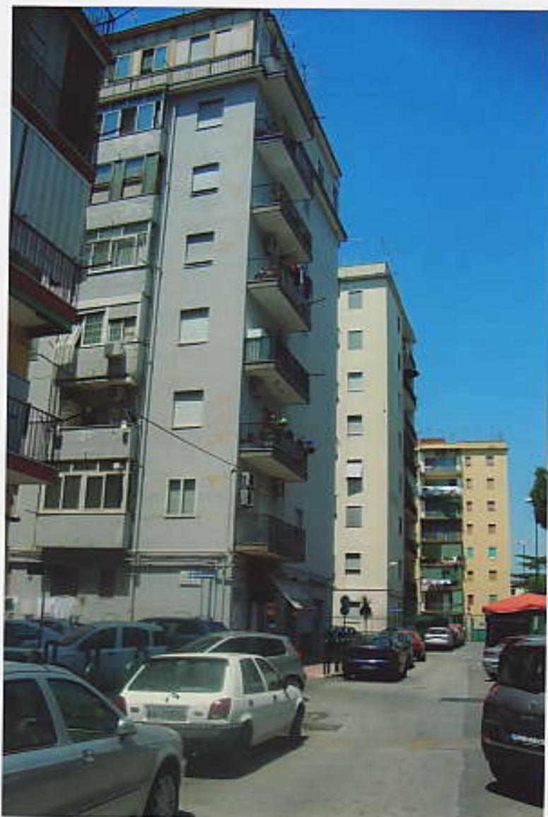
FOTO 11 Fabbricato su via Trav.Martirano