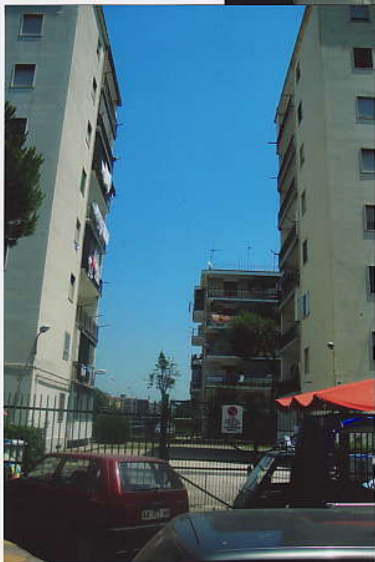
FOTO 8 Fabbricato su Via Martirano (con fondale vista area di cantiere)