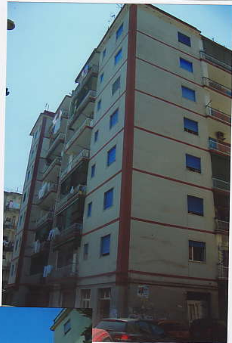
FOTO 9 Fabbricato su via Trav.Martirano