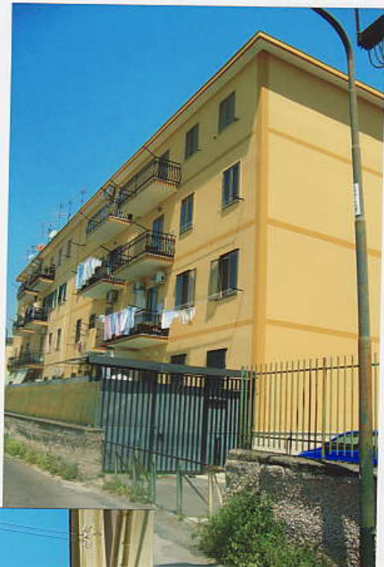
FOTO 3 Fabbricato su via Aviglione