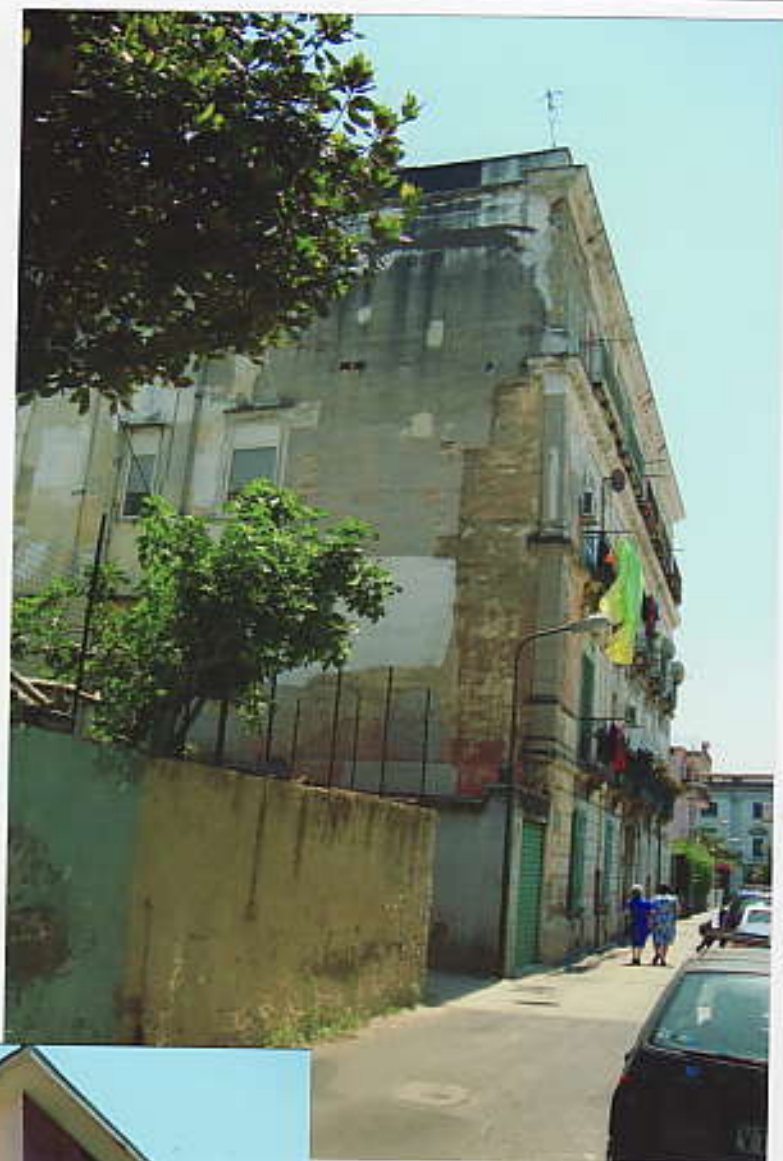
FOTO 1 Fabbricato su via Aviglione