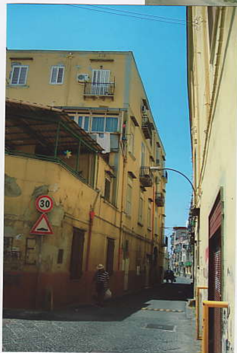
FOTO 4 Fabbricato su Via B. Quaranta incrocio di via Aviglione