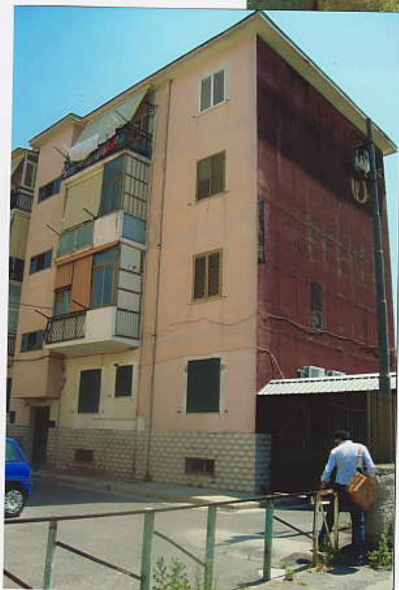
FOTO 2 Fabbricato su Via Aviglione