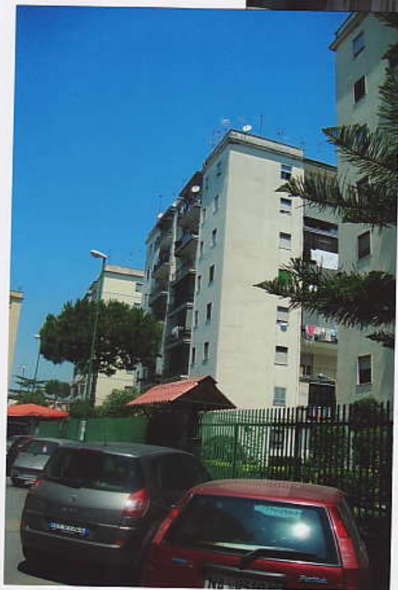
FOTO 10 Fabbricato su Via trav.Martirano