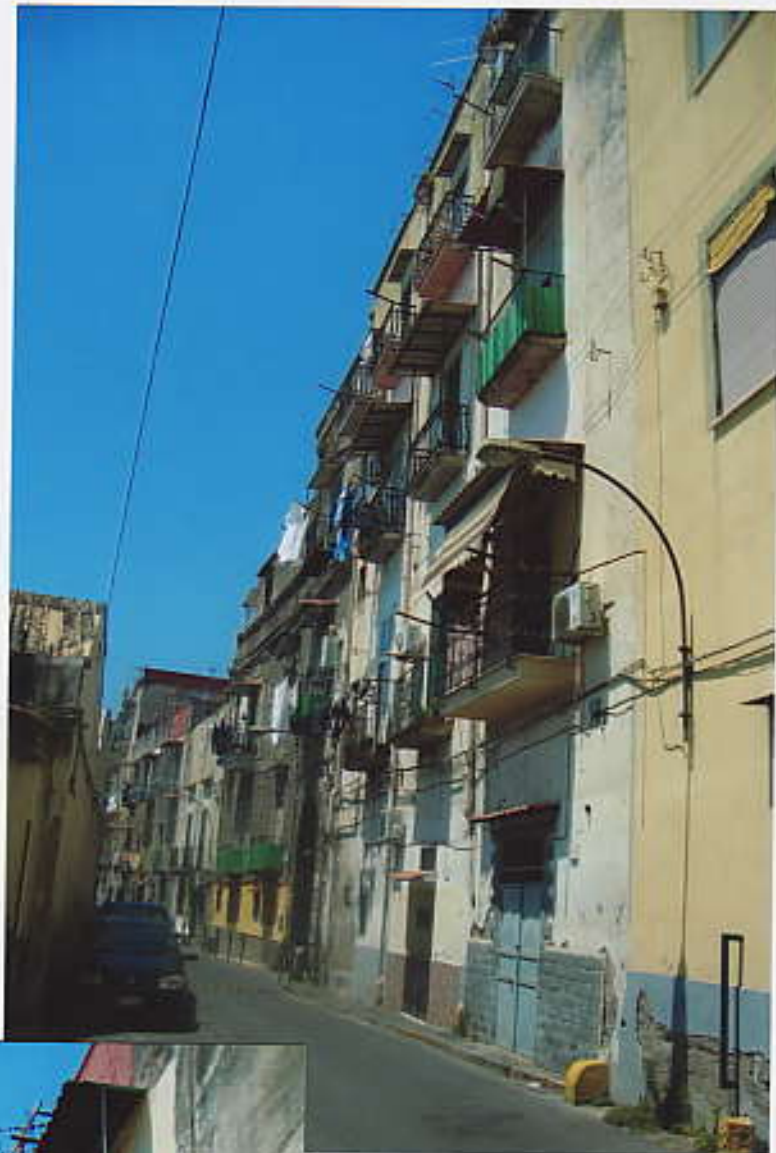
FOTO 5 Fabbricato su via B.Quaranta