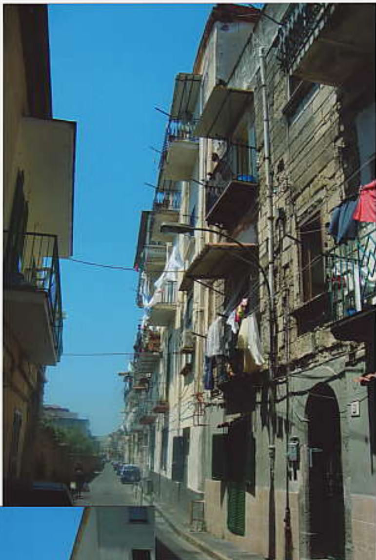
FOTO 7 Fabbricato su via B.Quaranta