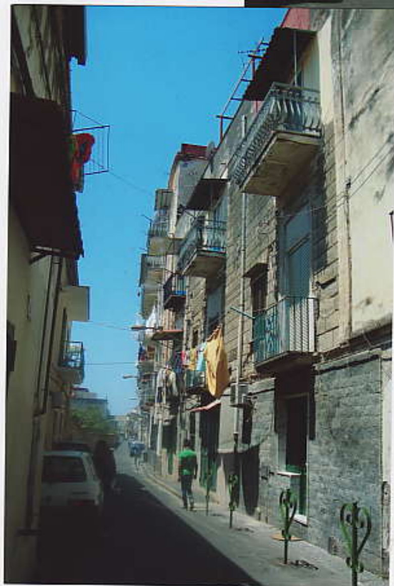
FOTO 6 Fabbricato su Via B.Quaranta