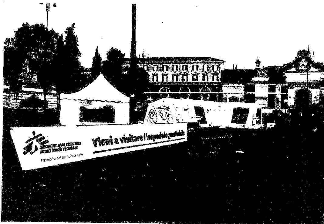
L'ospedale e il gazebo inpoint