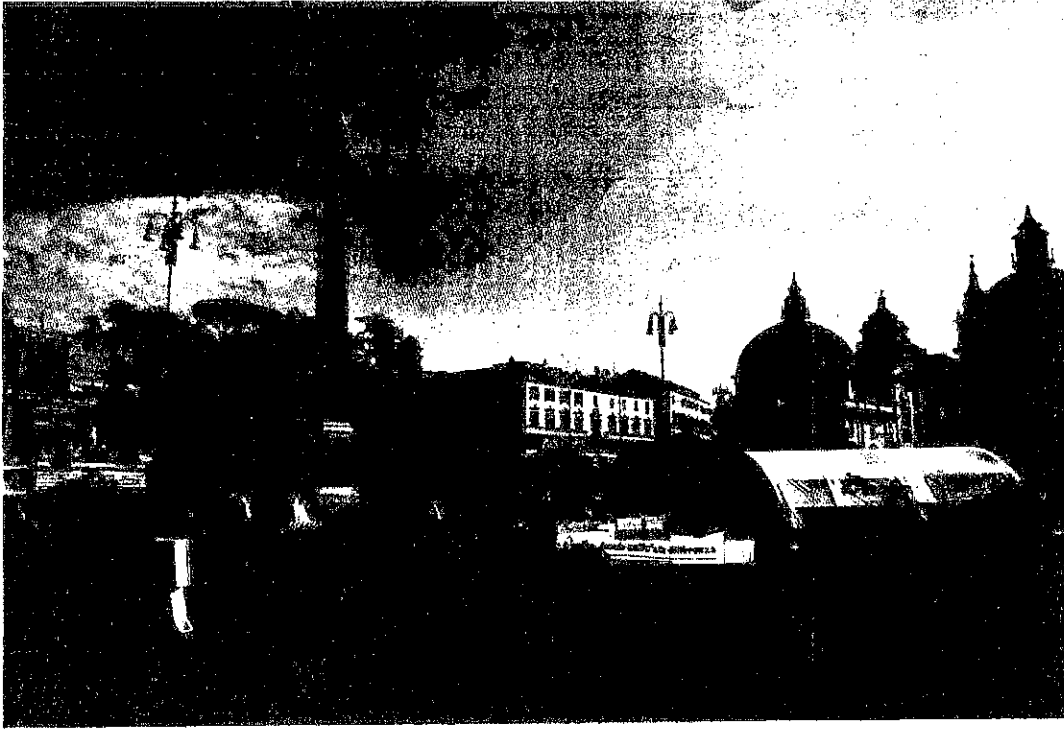
Hangar della logistica