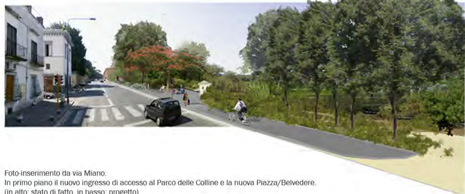
Foto-inserimento da via Milano. In primo piano il nuovo ingresso di accesso al Parco delle Colline e la nuova Piazza/Belvedere. (in alto: stato di fatto, in basso: progetto)