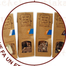
ME NE FA UN ETTO?