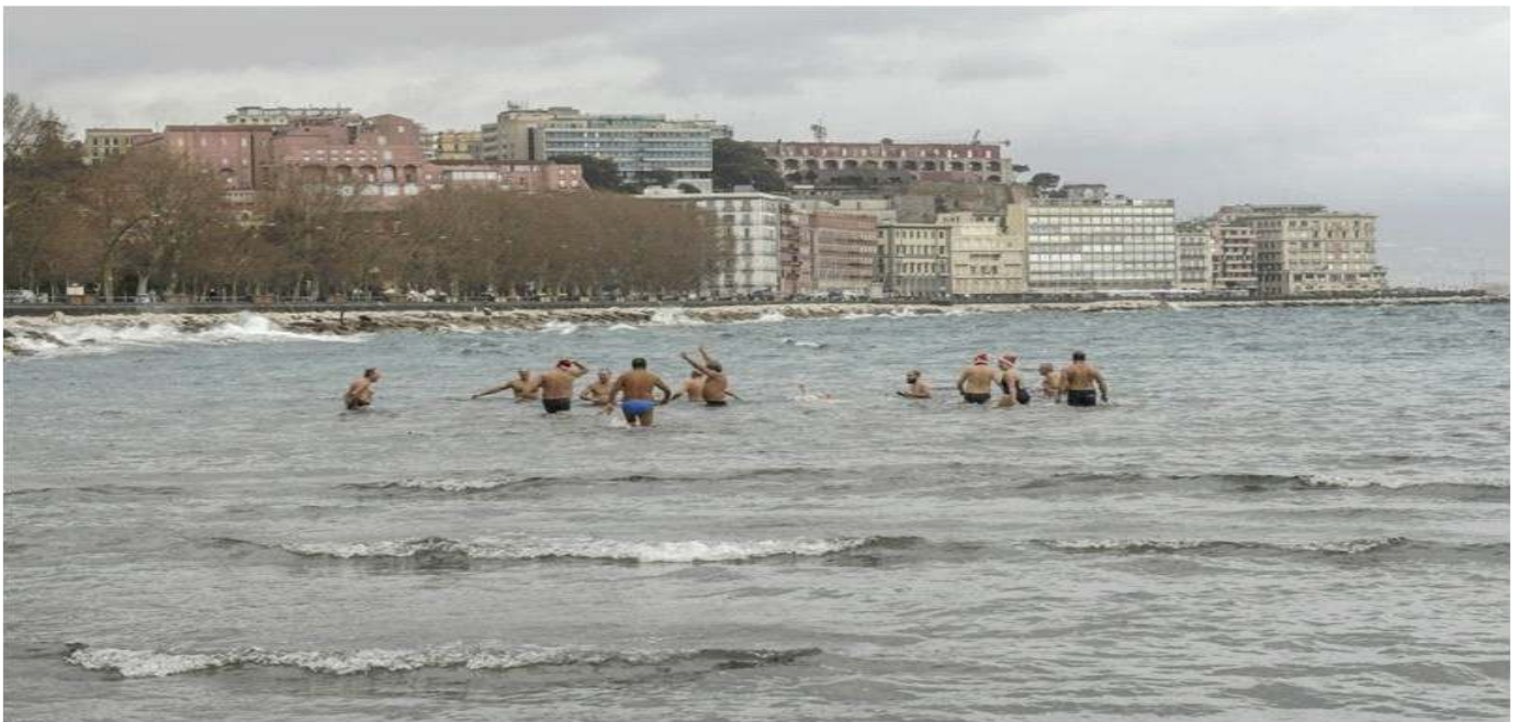
Rotonda Diaz gennaio 2018. - tradizionale tuffo a Capodanno.

La pioggia è stata pari a 64 mm il 13% in meno rispetto alla media stagionale, distribuita in 15 giorni.