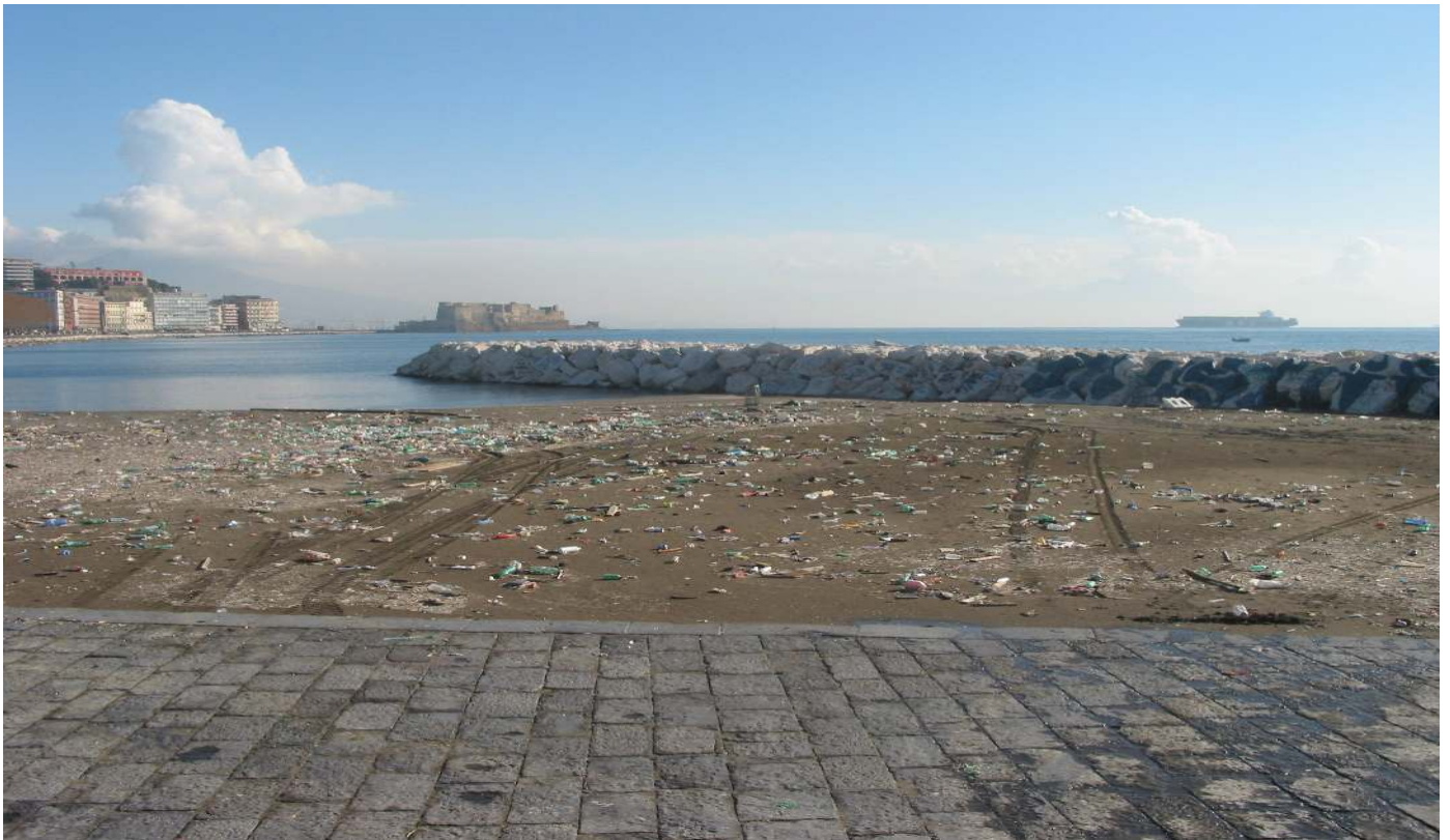
Gennaio 2018 - Arenile Rotonda Diaz. Pulizia e rimozione rifiuti.