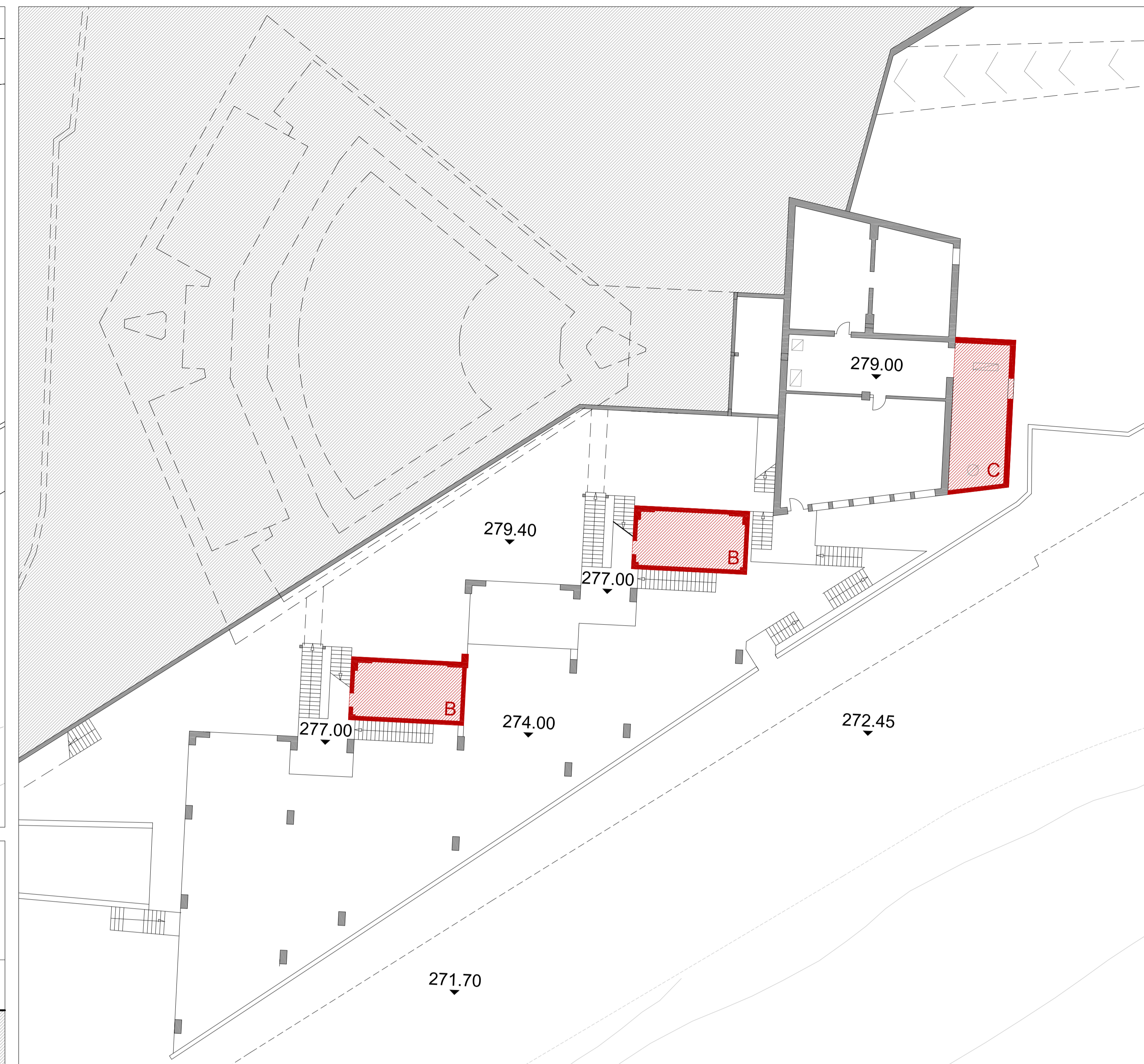
PIANTA QUOTA 279.5 - demolizione spogliatoi e cucina