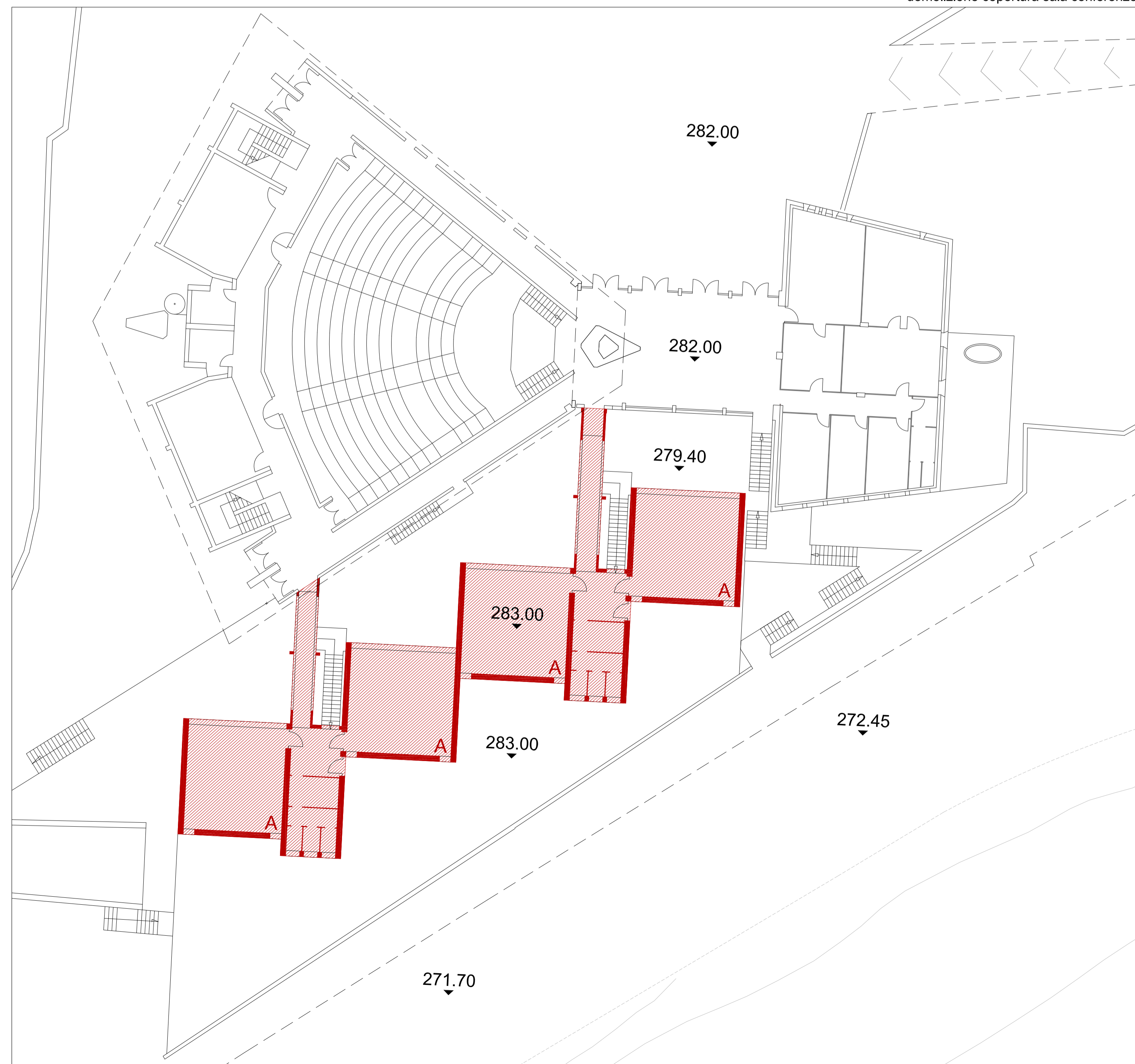
PIANTA QUOTA 284 - demolizione aule e servizi igienici